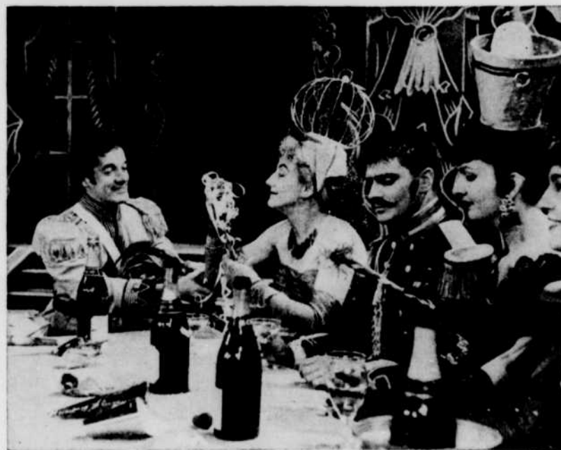
Une scène de "La Vie Parisienne"

LA SEMAINE À RADIO-CANADA DU 1er AU 7 SEPTEMBRE 1956