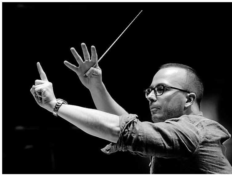
Yannick Nézet-Séguin sera au pupitre pour le concert de fin de 33 e saison de l'Orchestre Métropolitain.