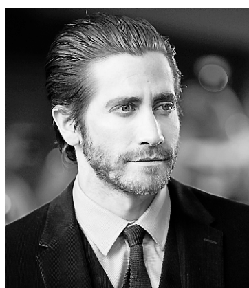
Jake Gyllenhaal