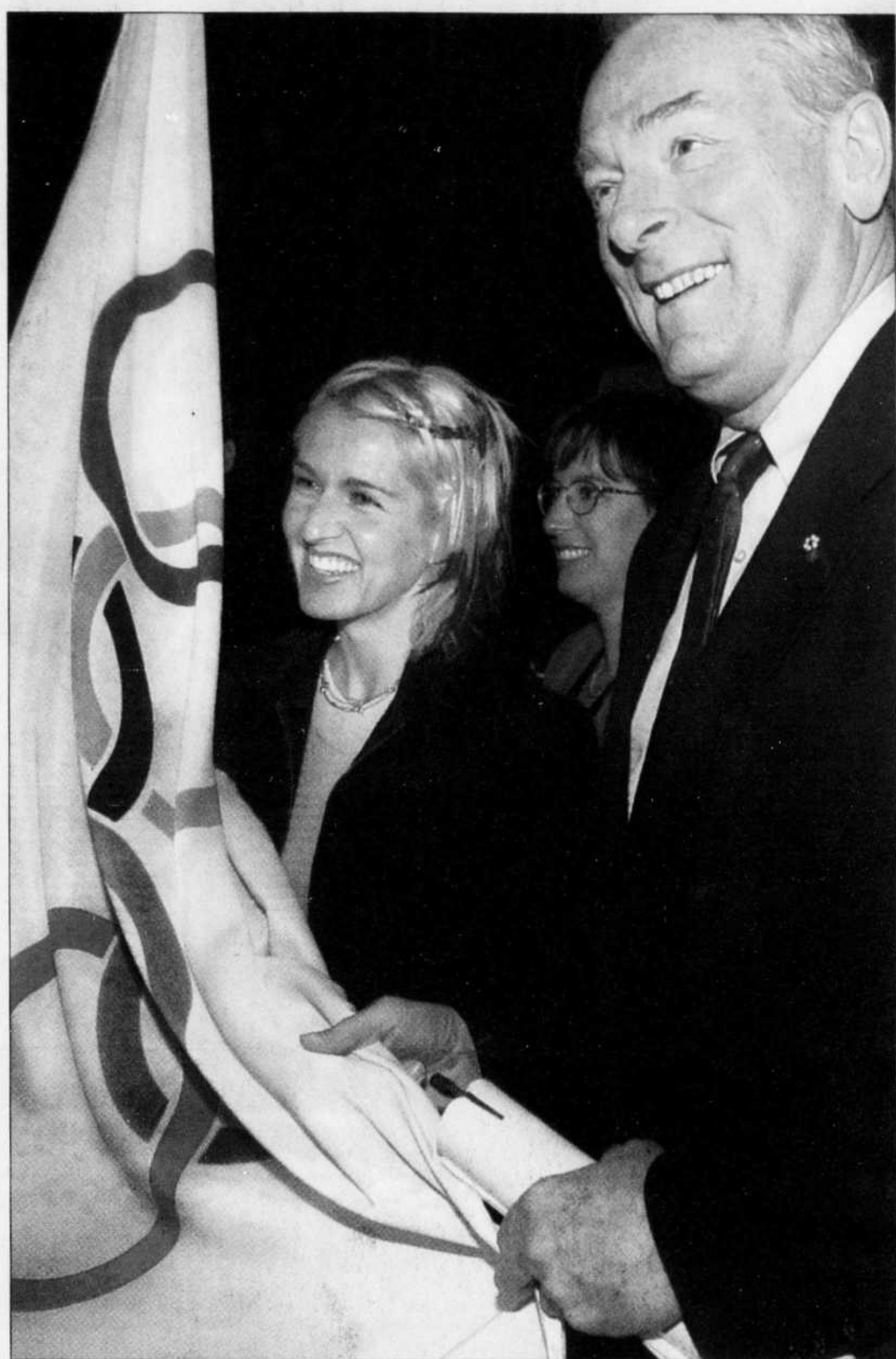
Photographié en compagnie de la championne olympique Myriam Bédard, Dick Pound a confirmé hier sa candidature au poste de président du Comité international olympique. L'élection aura lieu au mois de juillet prochain.