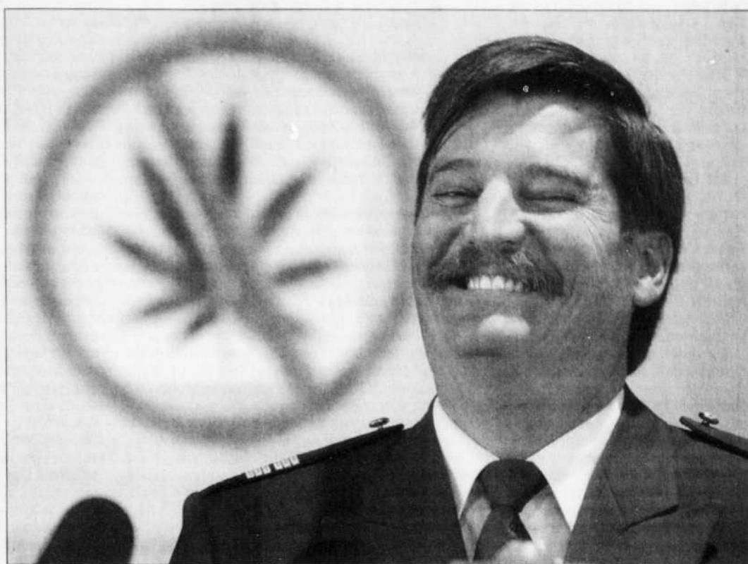
Le capitaine Richard Bruneau, directeur-adjoint de la lutte contre le crime organisé à la SQ, hier lors du lancement de l'Opération Cisaïlle 2001.

La SQ a livré une présentation visuelle instructive hier lors du lancement de l'édition 2001 de Cisaïlle. Les images révèlent que les horticulteurs ne plaisantent pas avec le business. Ils patrouillent les champs armés de mitraillettes AK-47, ils disposent des pièges à castors agrémentés de clous autour des plantations, ils menacent les agriculteurs qui as-