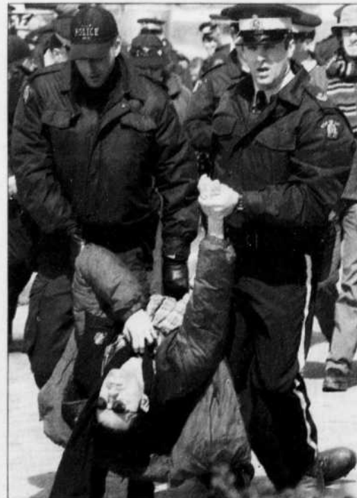
Des policiers procèdent à l'arrestation d'un manifestant devant l'édifice des Affaires étrangères et du Commerce international à Ottawa.

■ Lire aussi en page A 7: Le français, langue américaine