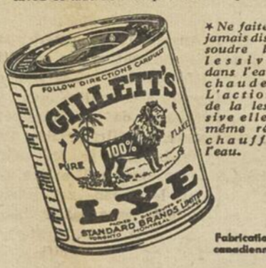
* Ne faites jamais dissoudre la lessive dans l'eau chaude. L'action de la lessive est même plus efficace dans l'eau froide.

BROCHURE GRATUITE! Ecrivez à Standard Brands Ltd., Fraser Ave. & Liberty St., Toronto, Ont., pour obtenir un exemplaire GRATUIT de la brochure Gillett expliquant comment la Gillett dégage les renvois d'eau, détruit le contenu des cabinets extérieurs, nettoie, stérilise, fait du savon et aide de multiples autres façons.