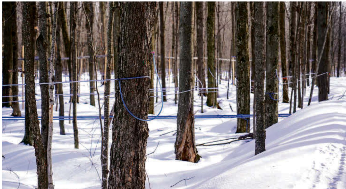
Des dizaines de mètres de tubes courant d'un érable à l'autre agrémentent le paysage des érablières.

Du côté de la cabane à sucre Au bec sucré à Valcourt, où les groupes peuvent profiter d'un buffet à volonté depuis le 25 février, la salle à manger de 140 places est déjà à pleine capacité pour toutes les fins de semaine du