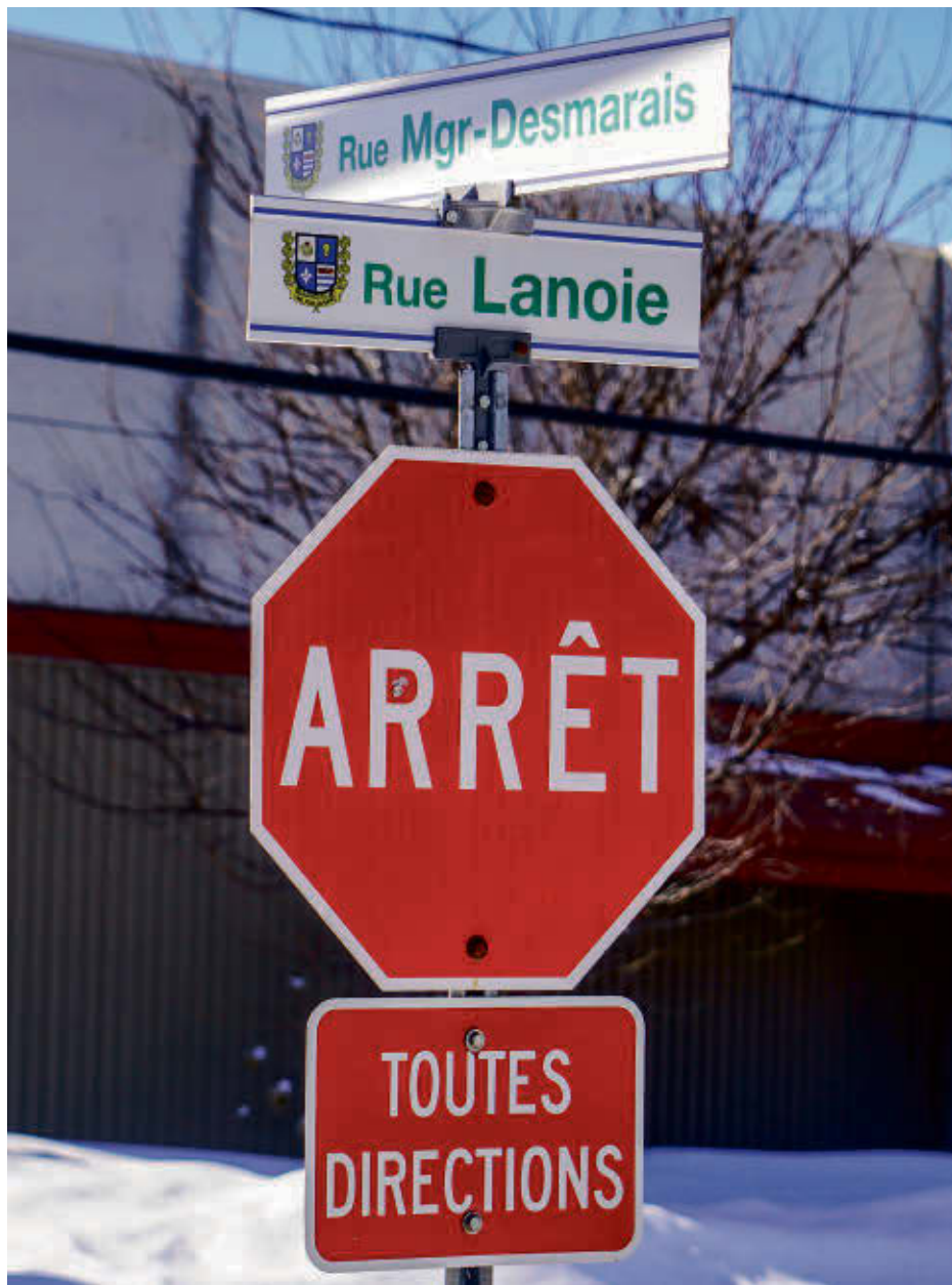
Des suspects s'en sont pris à une résidence pour personnes souffrant de déficience intellectuelle, située sur la rue Monseigneur Desmarais, à Upton.

La Division des enquêtes Montérégie-Est de la Sûreté du Québec (SQ) demande l'aide du public pour résoudre un dossier d'introduction par effraction, de méfaits et de vol à Upton.