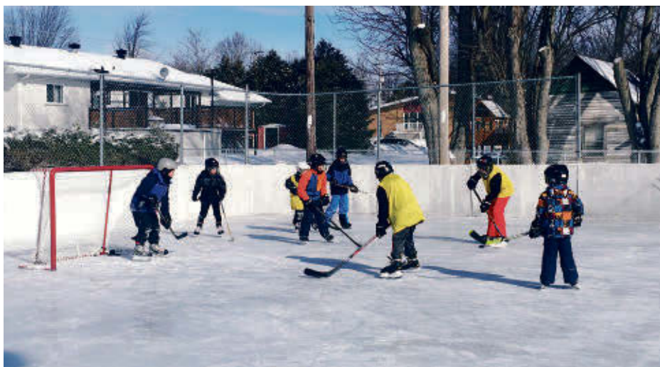
Jeunes et moins jeunes ont participé aux différentes activités extérieures.