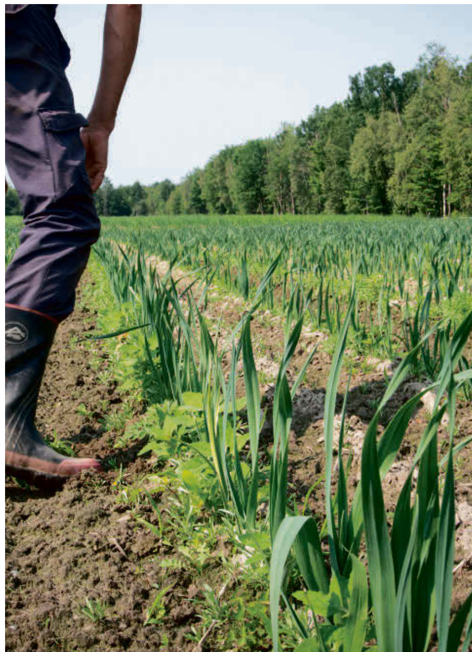
Les élus, formant le conseil des maires de la MRC du Val-Saint-François demandent d'adopter un cadre réglementaire plus strict en ce qui concerne les critères à respecter pour l'épandage des biosolides et d'y inclure les contaminants émergents préoccupants pour la santé humaine et des sols.

Québec a répondu favorablement à cette demande au cours des derniers jours en annonçant l'imposition d'un moratoire temporaire sur l'épandage de biosolides des États-Unis, et ce, jusqu'à ce qu'il revoit sa propre réglementation.