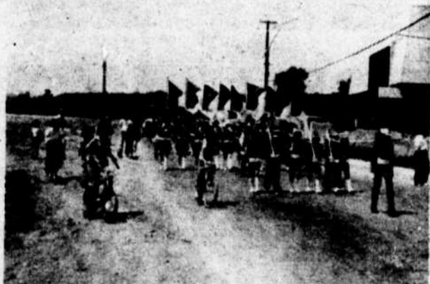
Comme c'était le cas partout au Québec, les enfants de l'avenir étaient à la tête de la parade.