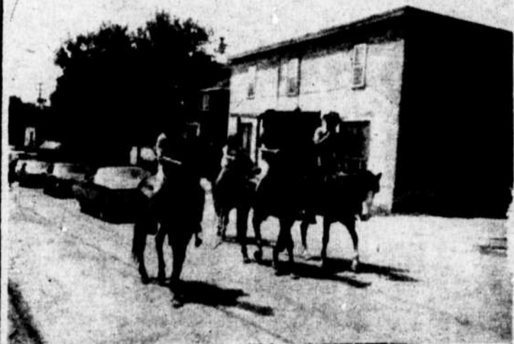
On fête à dos de cheval... et pourquoi pas?

Somme toute, la Saint-Jean Baptiste a su faire plus d'un heureux parmi les gens de chez nous et les québécois ont démontré une fois pour toutes qu'ils étaient capables eux aussi de célébrer dignement leur 108ième anniversaire!