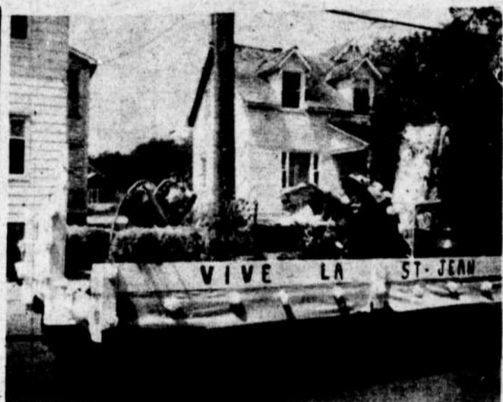
Deux ombrelles et deux jolies filles égalent une flotte des plus intéressantes!

La grande fête de la Saint-Jean est enfin terminée; les québécois peuvent maintenant se féliciter d'avoir accompli leur devoir culturel! Cette année, les citoyens canadiens purent constater comment solidaires, comment dynamiques pouvaient être leurs confrères confédératifs alors qu'ils virent la belle province soulevée par des cris de joie poussés par ses nombreux patriotes qui tous, désiraient se plonger dans une grande volupté humaine nourrie par le souvenir "des bons vieux jours."