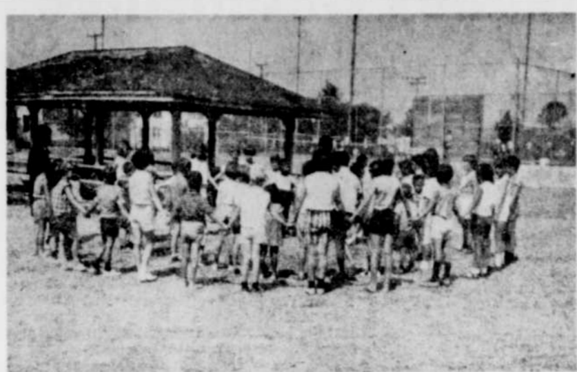
CHANSON. — A l'OTJ St-Maurice c'est la joie et la gaieté. On se réunit fréquemment en groupe pour chanter de tout coeur, comme l'illustre bien la photo ci-haut.

Les Mineurs de Thetford Mines continuent de perdre des joues en commettant des bévues à la défensive. L'équipe locale devra se ressaisir dans les prochains matchs, sinon elle sera évincée des séries éliminatoires.