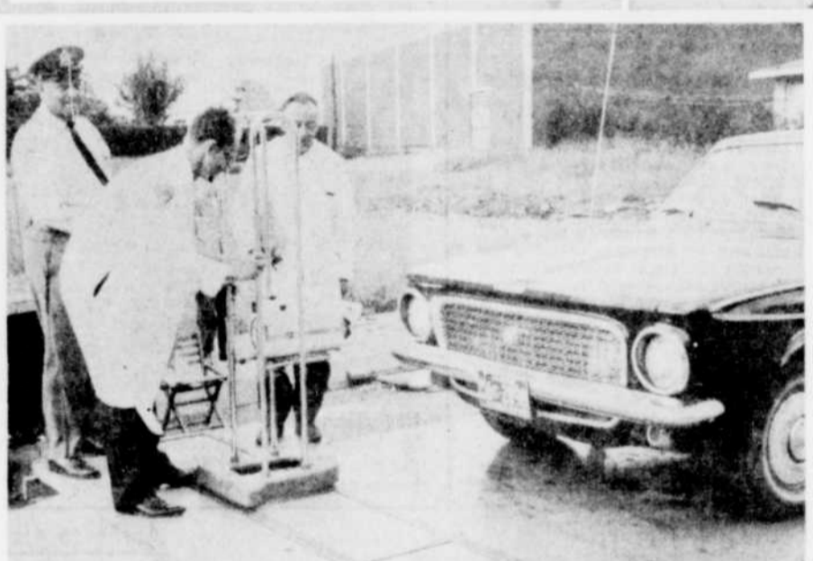
INSPECTION DES AUTOS. — Les allées d'inspection pour automobiles ont rendu service à bien des Granbyens qui en ont profité pour aller faire vérifier leurs véhicules. Ce service gratuit est dispensé par le ministère provincial des Transports et Communications.

Inspection des autos — Les allées d'inspection pour automobiles ont rendu service à bien des Granbyens qui en ont profité pour aller faire vérifier leurs véhicules. Ce service gratuit est dispensé par le ministère provincial des Transports et Communications.