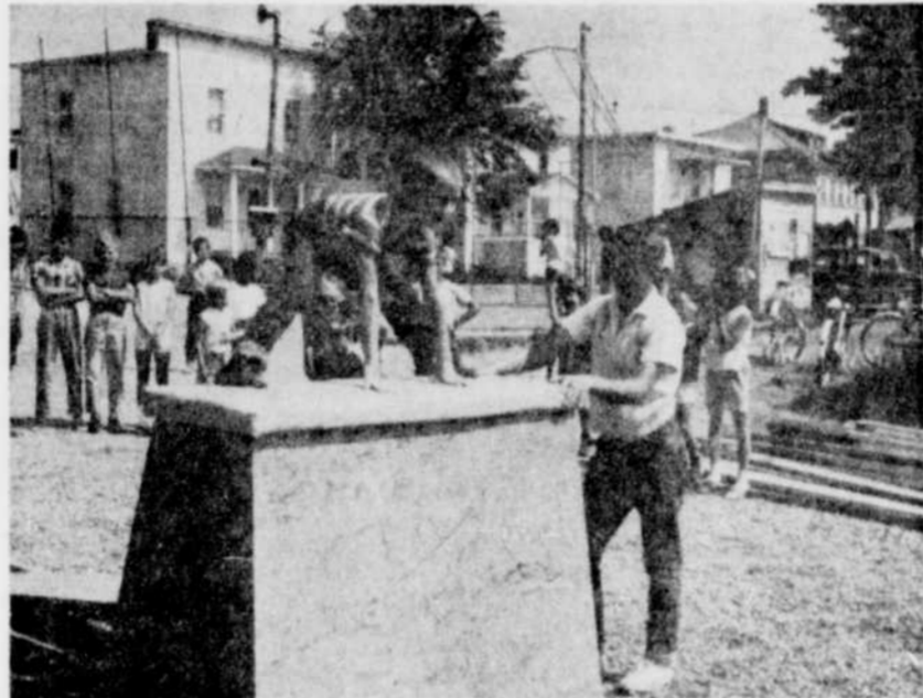
SAULT-PERILLEUX. — L'athlétisme jouit de beaucoup de popularité à l'OTJ St-Maurice. Ci-haut, un petit bonhomme qui réussit à la perfection un saut périlleux sur le cheval sauteur.