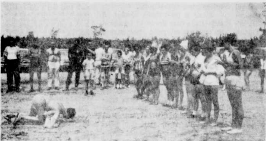
LES DIVERTISSEMENTS n'ont pas manqué hier, à la Plage municipale de Magog, alors que plus de 150 membres de l'Association des sourds et muets de la province de Québec ont tenu leur festival. Sur ces photos, quelques-uns des membres du groupe qui participent à des jeux organisés pour la 3e année consécutive à Magog.