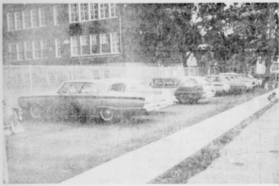
STATIONNEMENT. — Le terrain de stationnement que la cité de Granby a aménagé à l'arrière du bureau central de la Commission scolaire locale, rue St-Hubert vient juste d'être terminé et les automobilistes n'ont pas tardé comme on peut le voir, à l'utiliser. (Photo La Tribune, par F. Aubin, Granby)

Stationnement Le terrain de stationnement que la cité de Granby a aménagé à l'arrière du bureau central de la Commission scolaire locale, rue St-Hubert vient juste d'être terminé et les automobilistes n'ont pas tardé comme on peut le voir, à l'utiliser. (Photo La Tribune, par F. Aubin, Granby)