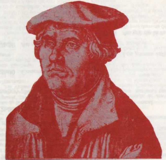
Les samedis 7 et 14 mai, LES GRANDES RELIGIONS souligneront le 500e anniversaire de naissance de Martin Luther (1483-1546) qui fut à l'origine de la Réforme. Il prêcha le retour à l'Église primitive et la reconnaissance de la Bible comme seule autorité en matière de foi.