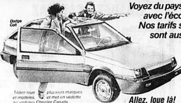
Tilden loue et modèles plus de 100 autres marques et met en vedette les voitures Chrysler Canada

Voyez du pays pour beaucoup moins avec l'économique Dodge Colt. Nos tarifs spéciaux du week-end sont aussi disponibles sur des modèles plus grands, y compris l'excitante Caravan.