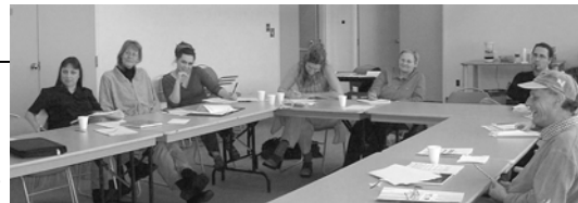
Formation Droits d'auteur en métiers d'art

De plus en plus, ça bouge dans la domaine des métiers d'art. On le sent à l'intérêt des artisans à former une table de concertation, à se regrouper pour monter des projets communs et à une relève grandissante. Le CCAT réalisera un portrait de cette discipline en région pour nous permettre de mieux connaître les artisans qui y et ainsi, prendre ensuite des actions concrètes pour son développement. Bien sûr, la collaboration des artisans nous sera précieuse. Attendez-vous à nous révéler vos secrets bientôt.