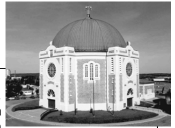
Cathédrale Sainte-Thérèse d'Avila

L'an passé à pareille date, la ministre d'État à la Culture et aux Communications, madame Diane Lemieux, émettait un avis d'intention de classement pour la cathédrale Sainte-Thérèse d'Avila à Amos. C'est maintenant officiel : la cathédrale a enfin obtenu le statut de bien culturel en tant que monument historique.