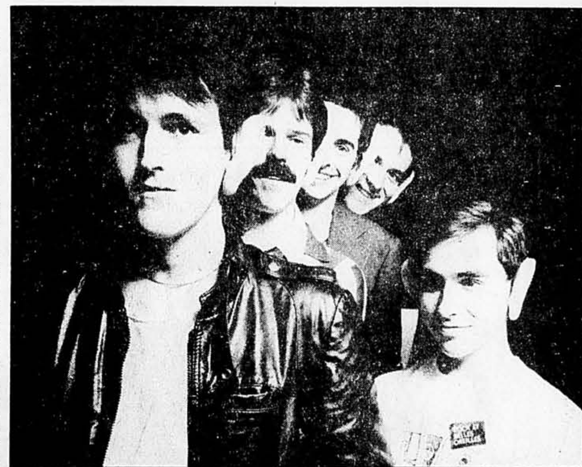
L'équipe de Rock et belles oreilles.