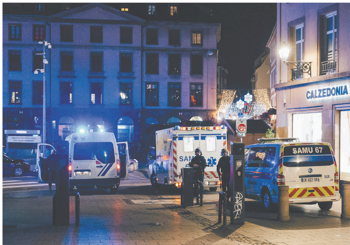
Le parquet de Paris a ouvert une enquête pour « assassinat, tentative d'assassinat en relation avec une entreprise terroriste et association de malfaiteurs terroriste criminelle ».

En l'espace de quelques minutes, la foule présente dans les allées illuminées de la métropole alsacienne est évacuée par les forces de l'ordre, le centre-ville est bouclé et évacué. De rares badauds, ignorant la situation,