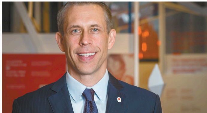
David Shoemaker

« L'ampleur de mon expérience internationale est une question dont nous avons beaucoup parlé avec le conseil d'administration du COC. J'aime croire que cet aspect de mon CV m'a bien servi. »