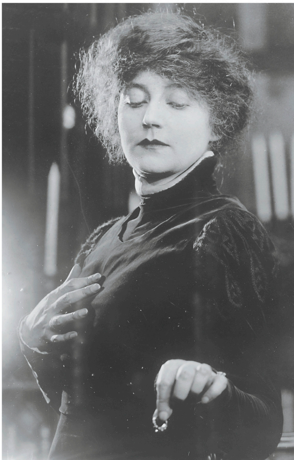
Portraits de Mary MacLane en 1918 (photo de gauche) et en 1902 (photo en haut à droite). Affiche du film Men Who Have Made Love to Me (1918), adaptation du livre I, Mary MacLane de Mary MacLane, dans lequel elle réalise et interprète son propre rôle.