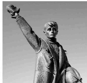
Monument de la marine marchande à Québec