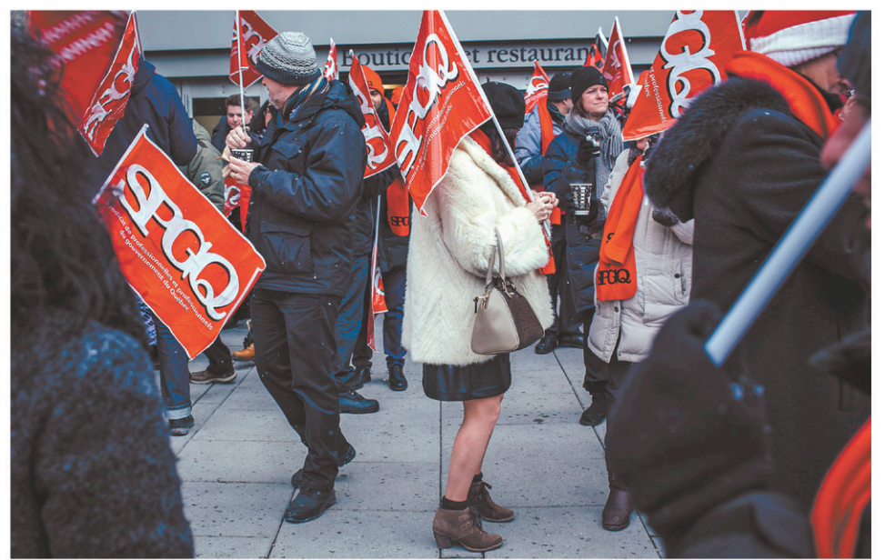
Une manifestation a eu lieu mardi, à Montréal, devant le Complexe Desjardins.

Les négociations à Revenu Québec ont commencé en 2015, au moment où l'ancienne convention collective prenait fin