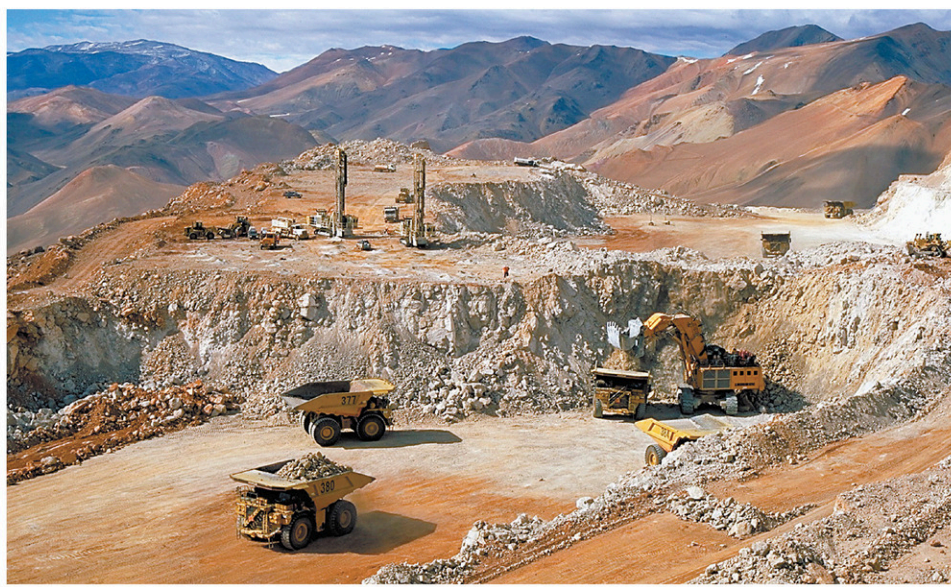
La mine d'or de la canadienne Barrick Gold à Veladero, en Argentine BARRICK GOLD

Mais dans l'ensemble, Royal LePage donne un portrait d'un marché serré. «Avec un nombre croissant de travailleurs profitant d'un emploi stable [...] et la rareté des logements locatifs, les décideurs politiques dans nos principaux marchés seront confrontés une fois de plus à la pénurie de logements. Au-delà d'un problème d'abordabilité, nous devons encore une fois composer avec une crise de l'offre dans le paysage immobilier résidentiel.»