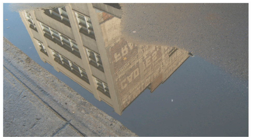
Dans le documentaire Ville de partage, portrait de ma liberté, reflet de mon âme , le groupe de sans-abri donne sa vision de la ville.

VILLE DE PARTAGE, PORTRAIT DE MA LIBERTÉ, REFLET DE MON ÂME