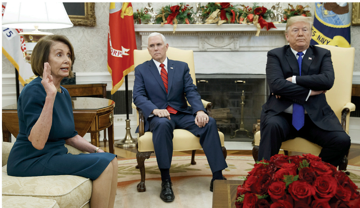
Une rencontre sur les négociations sur la loi budgétaire a donné lieu mardi à de vifs échanges entre la démocrate Nancy Pelosi et le président Donald Trump, sous le regard du vice-président Mike Pence.