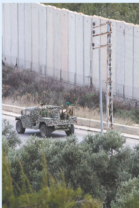
La frontière libano-israélienne