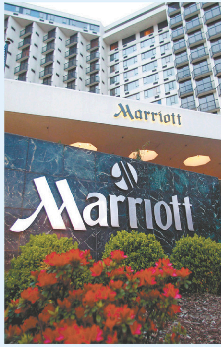
RICK BOWMER LA PRESSE CANADIENNE