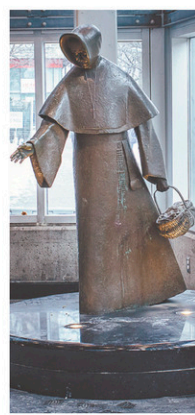
À Montréal, des milliers de personnes passent tous les jours, à la sortie du métro Berri-UQAM, devant sa représentation d'Émilie Gamelin (1999) coulée dans le bronze