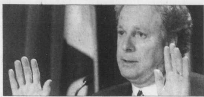
Jean Charest: « L'industrie va braver la crise. »

« Ça fait partie des discussions, le coût de la fibre, mais le coût de la fibre au Québec, c'est moins cher que ce qui se paie actuellement en Colombie-Britannique et au Nouveau-Brunswick. Ce n'est pas le seul élément dont on doit tenir compte », a affirmé le premier ministre du Québec, qui était de passage, hier, à Candiac sur la Rivière-Sud de Montréal.