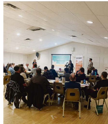
Séance de consultation publique à Wickham, en mars dernier.

Le territoire se démarque par une production élevée de poulets et dindons, avec des revenus qui représentent 86 % des recettes de la MRC pour cette seule production. Les élevages en bovins laitiers ainsi que ceux du porc se positionnent favorablement avec, respectivement, des recettes de 37 M$ et de 16,3 M$. Également, en nombre d'entrepri-