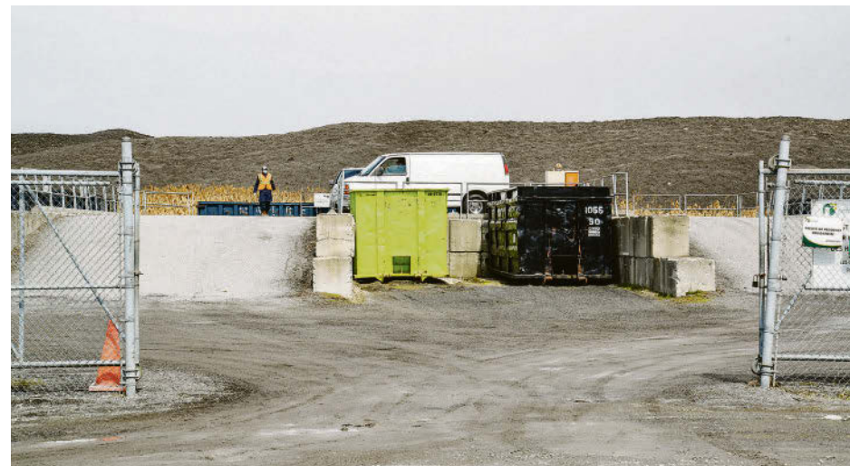
Les écocentres de la Régie intermunicipale d'Acton et des Maskoutains ont connu une hausse d'achalandage en 2023 et ont permis de valoriser 81 % des matières qui y ont été apportées.

Pour consulter le bilan annuel, rendez-vous sur le site Internet de la Régie.