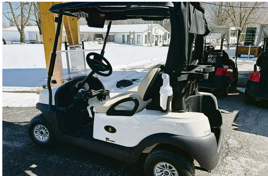
Les nouvelles voiturettes du Club de golf Acton Vale.

Comme l'an dernier, l'achalandage est en hausse avec une augmentation d'environ 10 % pour un total de plus de 300 membres. Cette année, les golfeurs ont le plaisir de profiter des toutes nouvelles voiturettes électriques qui se démarquent grâce à leur écran GPS aux nombreuses fonctionnalités. Elles ont été fraîchement