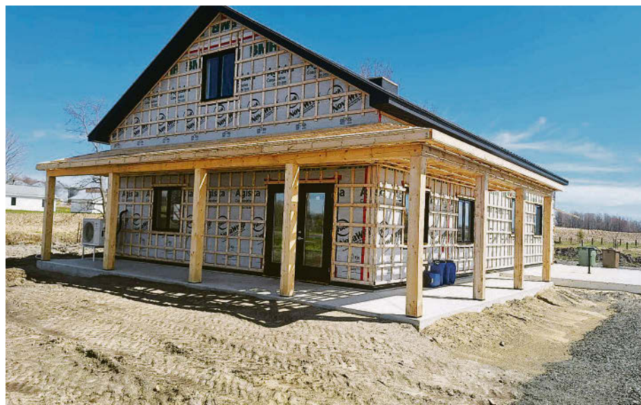
Le futur kiosque de la Ferme du petit 6 se veut un élément de vitalité à Saint-Théodore-d'Acton.

« Je suis vraiment très reconnaissante de ce prix, car nous tentons d'apporter de la vitalité dans notre petite municipalité avec notre projet et notre kiosque », a commenté Joëlle Gauthier. La construction d'un kiosque bat présentement son plein et accueillera ses premiers visiteurs et acheteurs très bientôt. Ce nouveau bâtiment, situé au coin du Petit 6 e Rang et du 5 e Rang, comprendra la boutique, mais aussi une salle réfrigérée, une salle de conditionne-