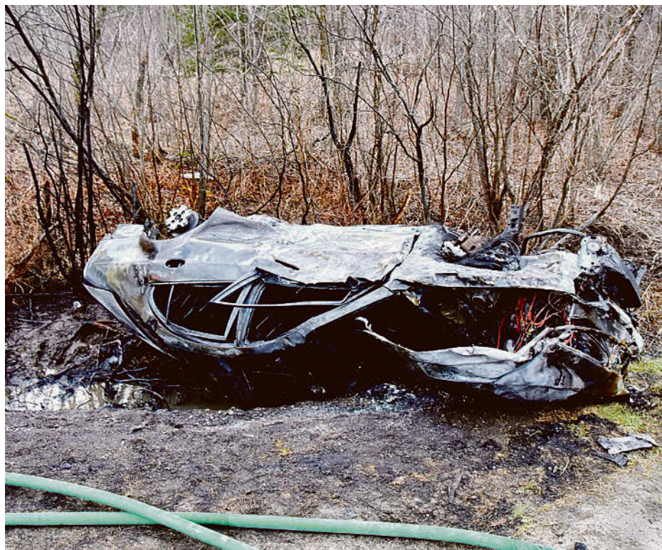
Un homme a été gravement blessé dans un accident de la route à Lefebvre.