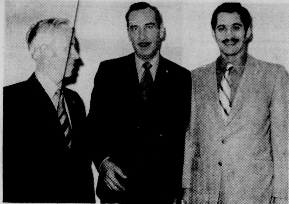
Les activités de la campagne de charité du club Richelieu de Victoriaville ont vraiment pris un bon départ cette année. Après le succès du thé-moade, la dégustation de vin et fromage de samedi soir a enregistré un nombre de présences supérieur à l'an dernier alors qu'environ 550