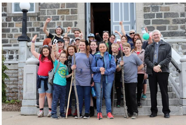
Le camp Les Aventuriers de la vie est l'un des projets soutenus par la Fondation pastorale qui permet à des jeunes de vivre des expériences fondatrices pour leur cheminement de vie et de foi.

La campagne annuelle de la Fondation pastorale vise un objectif de 200 000 $, cette année, alors que la collecte de l'an dernier a obtenu des résultats de 182 453 $, pour 2020 dons reçus. Il s'agit de 47 dons individuels de plus que l'année précédente (2017), ce