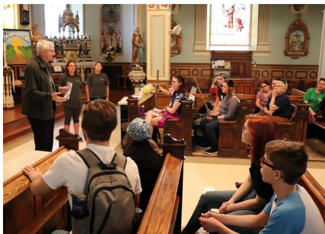
Les marcheuses et marcheurs ont entendu l'Évêque leur dire que «l'Église, c'est le monde», et qu'ils en font partie.