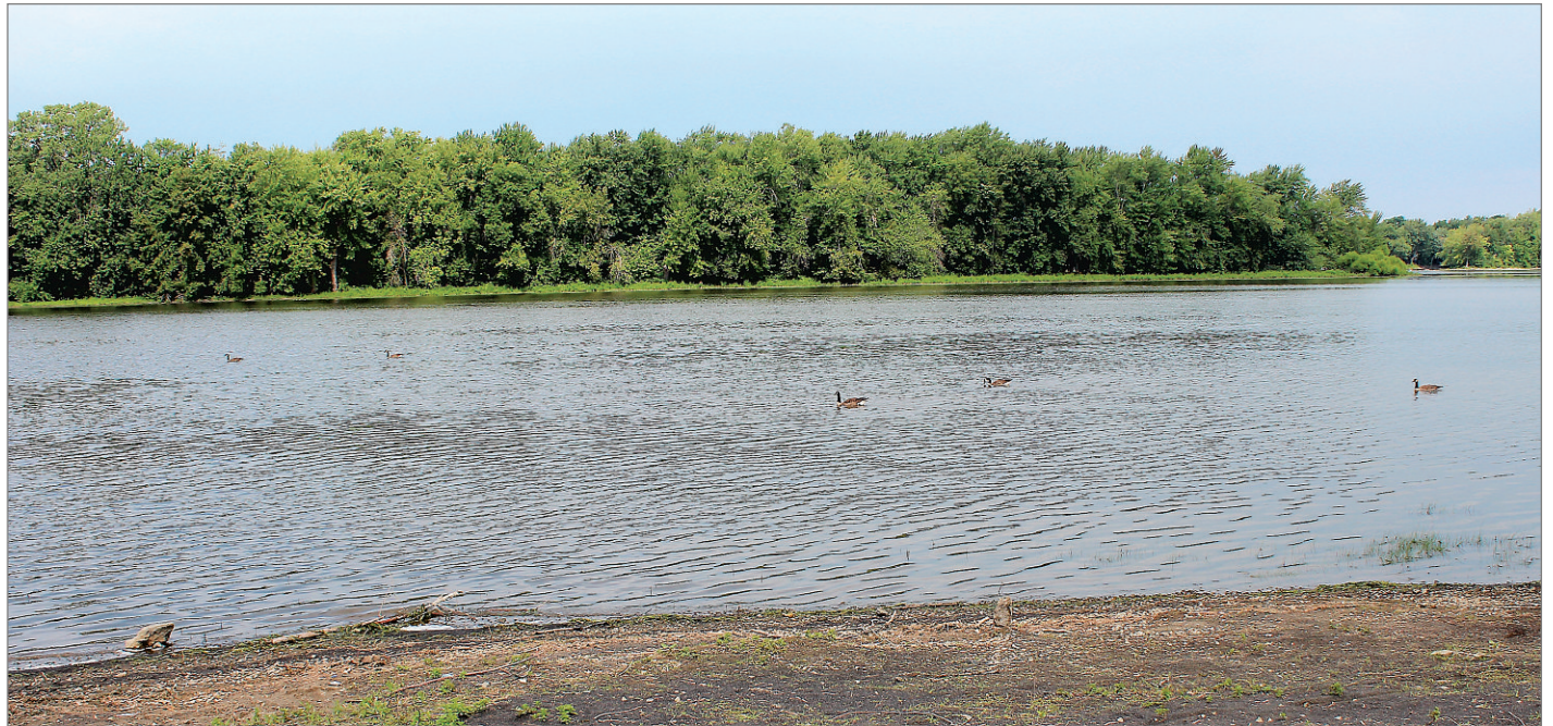
Les Lavallois pourraient revoir des plages faire leur apparition sur l'île Jésus à moyen terme. Sur la photo, la berge des Baigneurs, à Sainte-Rose.

«Les abords du pont Lachapelle, à Chomedey, ont un très beau potentiel, tout comme ceux du pont Viau, explique celui qui croit que le projet ferait l'unanimité. Je pense que ce serait accueilli très favorablement et il ne devrait pas y avoir beaucoup de contestations.»