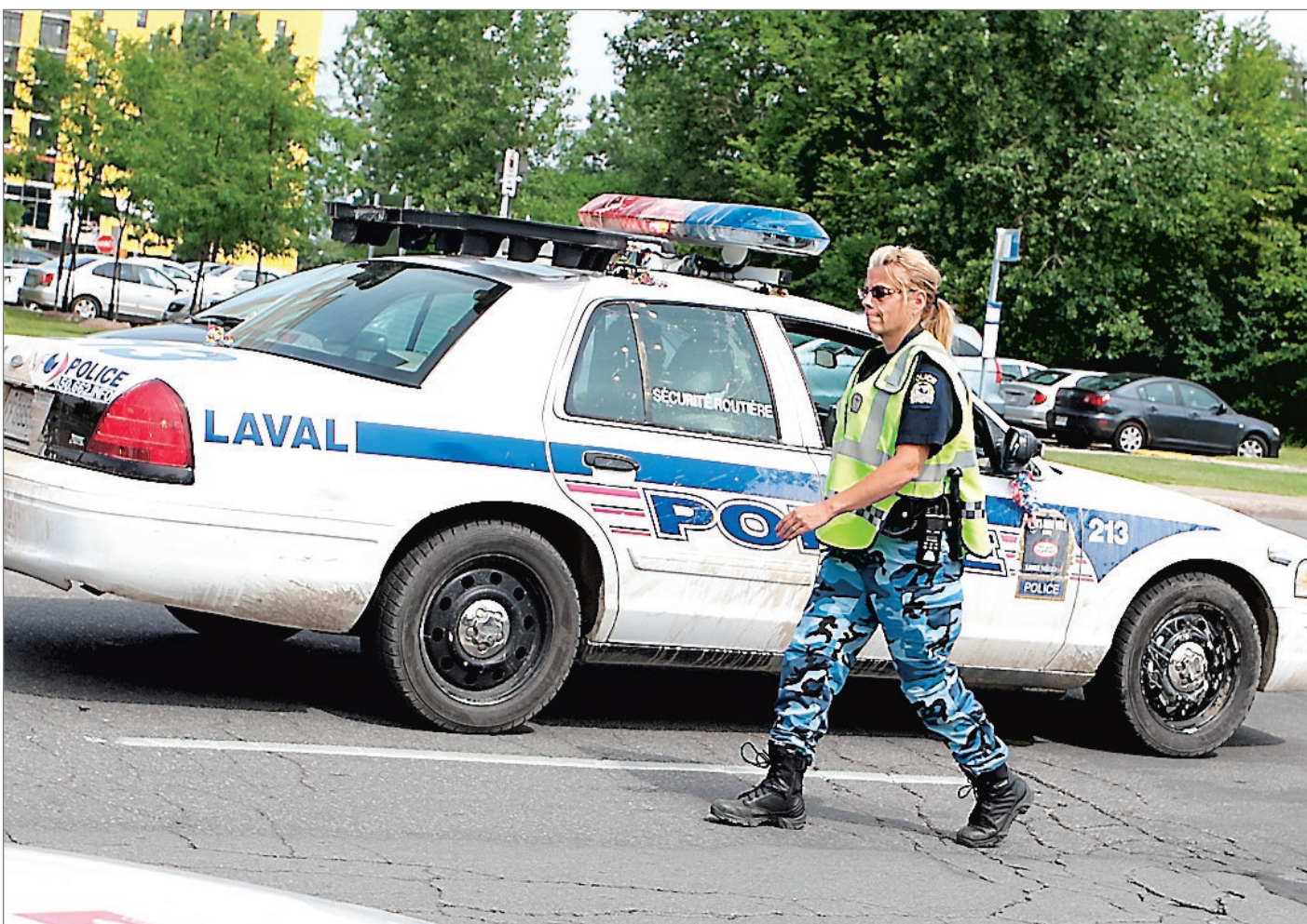
Les policiers et les pompiers ont adopté le port du jeans ou du pantalon de camouflage. En plus, des autocollants de la Coalition syndicale pour la libre négociation ont été apposés sur leurs véhicules. Des auto-patrouilles de la police ont aussi été enduites de boue.

Le projet de loi du gouvernement Couillard prévoit notamment le partage obligatoire 50-50 des coûts des régimes de retraite entre les employés et les villes. Il prévoit également la constitution d'un fonds de stabilisation afin de protéger les régimes d'éventuelles crises financières.