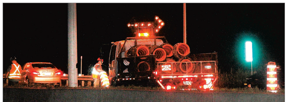
Pour une période d'un an, à compter de la semaine prochaine, on procédera à la réfection de parapets de deux ponts d'étagement de l'autoroute 19 soit ceux du boulevard St-Martin Est et de la voie ferrée du Chemin de fer Québec-Gatineau.

Quant au boulevard Saint-Martin Est, il sera partiellement fermé de nuit, mais conservera une voie dans chaque direction, du lundi au mercredi et le dimanche, entre