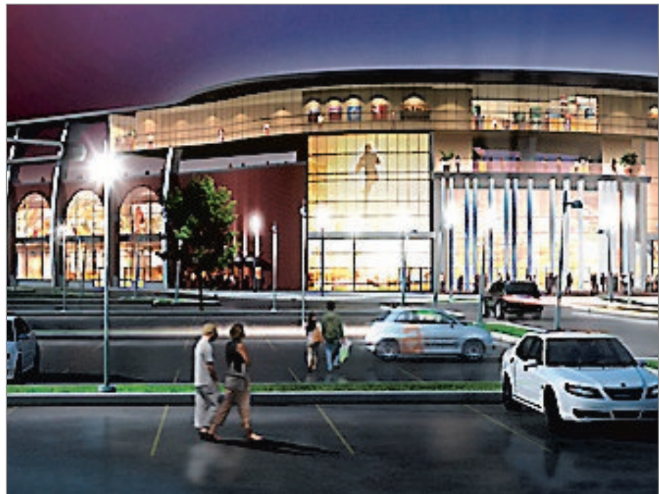
La Ville de Laval n'est plus la seule en lice pour accueillir le centre d'excellence de Baseball Québec.

D'autres sports pourraient aussi bénéficier des lieux pour leurs entraî-