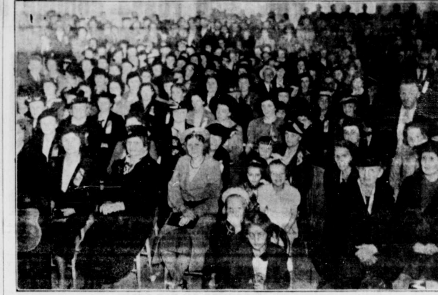
Une foule considérable a assisté hier après-midi à la séance publique qui marquait le grand concours annuel inter-cercles des Fermières du comté de Wolfe. Cette photographie a été prise pendant la séance et fait voir une partie des visiteurs qui étaient venus de toutes les parties du district.