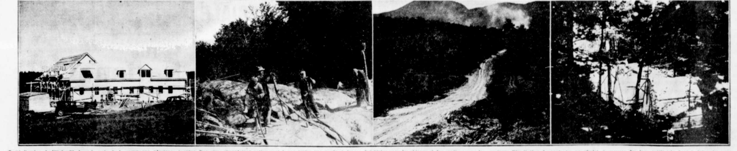
« L'ombre de l'Orford », dans la paix de la campagne, plusieurs équipes d'ouvriers s'emploient activement à construire une route, à tracer des pistes pour les skieurs et des sentiers pour les amateurs d'équitation, à construire un chalet, à creuser des lacs artificiels, bref à faire du parc national un magnifique centre touristique. Voici quelques vues de l'état des travaux. De gauche à droite, le chalet, style "village maison canadienne", un voit-voit le côté qui donne sur le Mont Orford. Ce sont ensuite quelques-uns des ouvriers qui, armés de foreuses automatiques, construisent le chemin conduisant au sommet du Mont. La troisième photo est une vue plus générale de la route percée dans un cadre grandiose. Enfin, on voit quelques unes des tentes qui logent les jeunes gens participant au programme d'entraînement forestier exécuté en vertu de l'entente Bourque-Rogers.