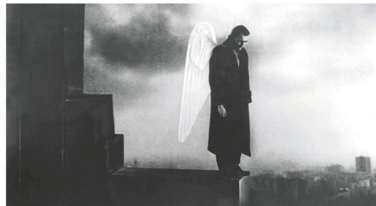
Les ailes du désir met en vedette Bruno Ganz