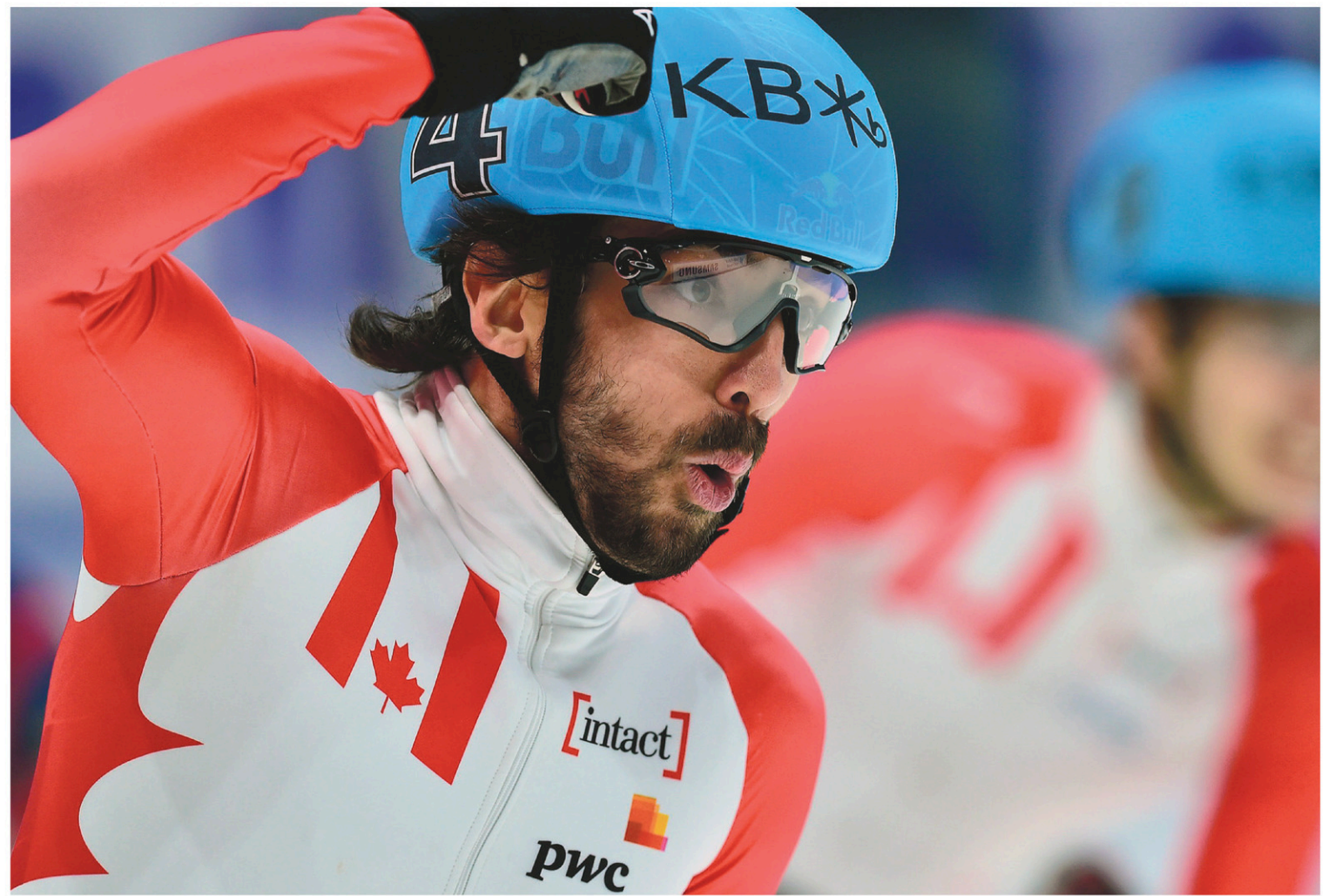
Charles Hamelin s'est offert l'or durant la deuxième épreuve de 1000 mètres de la Coupe du monde de l'ISU de patinage de vitesse sur courte piste de Gangneung, en Corée du Sud, dimanche.