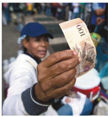
Le billet de 100 bolivars n'a finalement pas été supprimé.

Dimanche dernier, Nicolas Maduro avait pris par surprise ces concitoyens en décrétant le retrait sous trois jours de ces billets, afin de lutter contre les «mafias internationales»