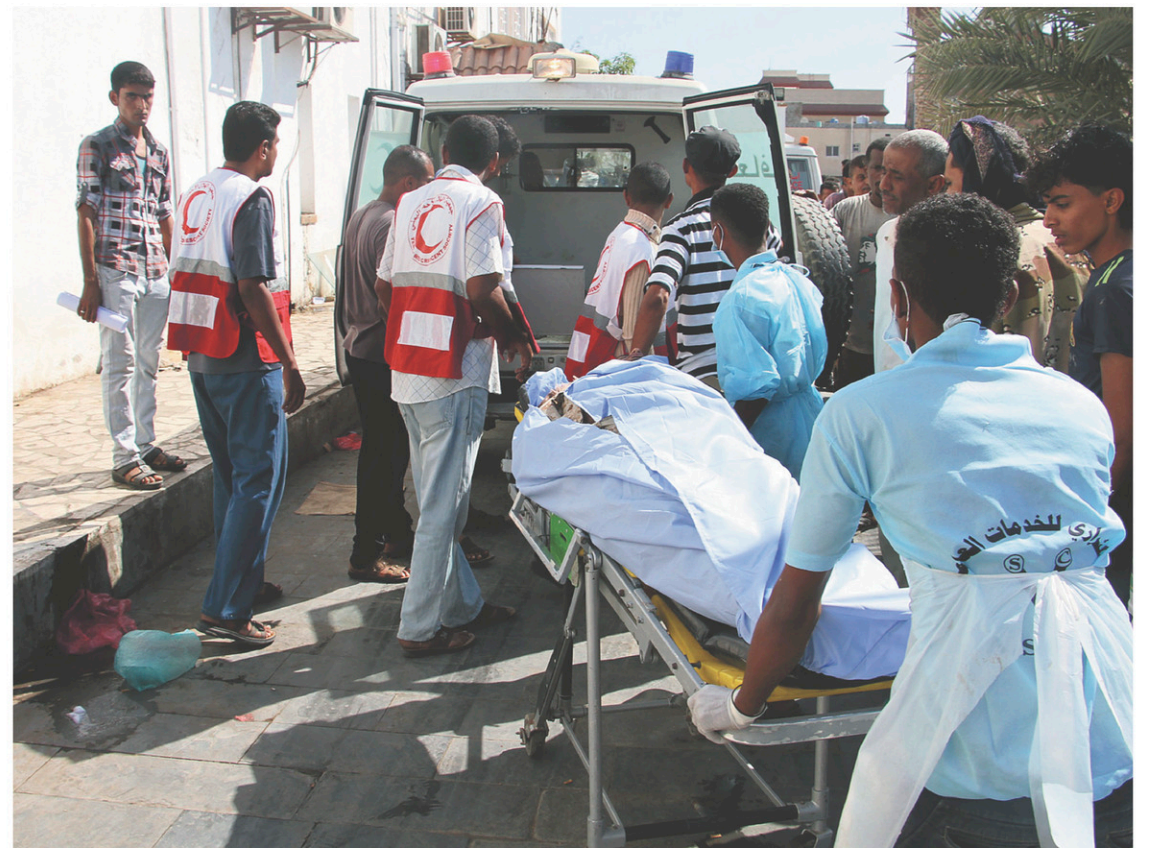
L'attentat de dimanche, qui a fait 48 morts et 84 blessés à Aden, est survenu huit jours après une attaque similaire le 10 décembre.

Le groupe EI et al-Qaïda ont profité du chaos engendré par la guerre au Yémen pour multiplier leurs actions dans le sud, notamment contre les