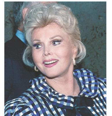
Zsa Zsa Gabor en 1989