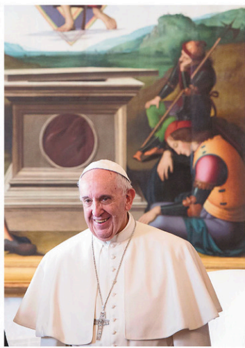
Le pape François, samedi

Parmi eux, le président américain, Barack Obama, lui a exprimé sa gratitude pour son soutien dans la normalisation des rapports avec Cuba. De hauts responsables religieux comme le chef des anglicans, Justin Welby, et le patriarche orthodoxe de Moscou, Kirill, lui ont aussi adressé leurs vœux.