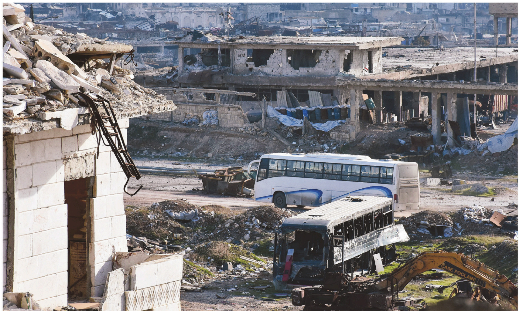
Des autobus ont traversé les quartiers dévastés d'Alep pour permettre l'évacuation de centaines de personnes dimanche.

François Brousseau est chroniqueur d'affaires internationales à Radio-Canada. Cette chronique fait relâche pour les Fêtes et sera de retour le 9 janvier 2017.