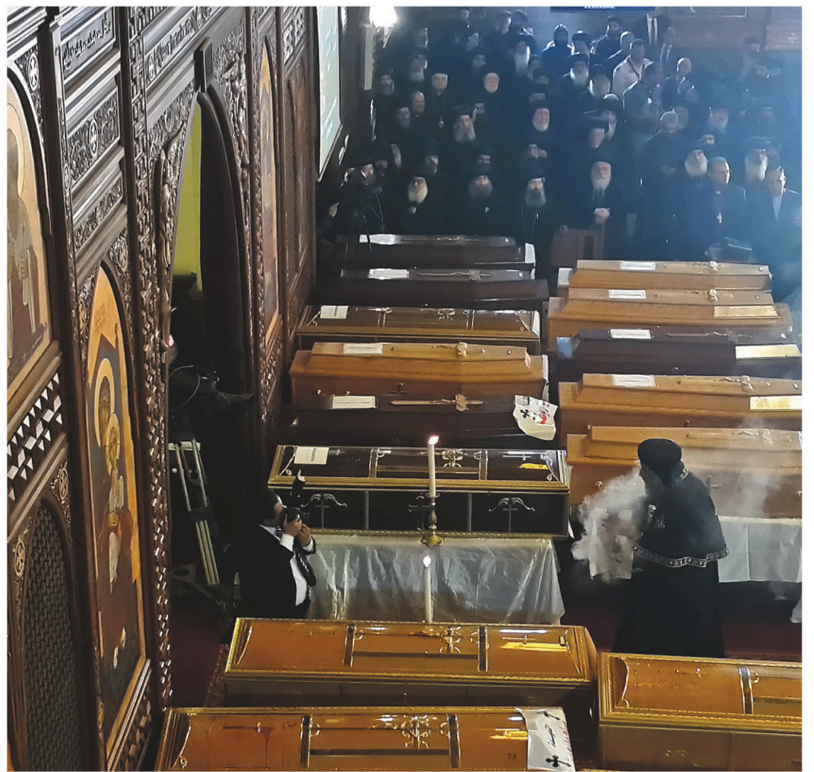
Les funérailles des victimes de l'attentat de la semaine dernière ont été célébrées avec plusieurs membres du clergé copte d'Égypte.