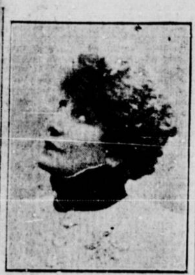
SARAH BERNHARDT, (dans "l'Assommoir"), qui consent à modifier son programme de représentations à Montréal, se rendant ainsi à la demande de Monseigneur l'Archevêque.