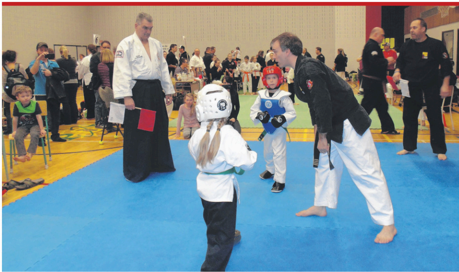
Plusieurs combats et katas ont eu lieu pendant la journée.