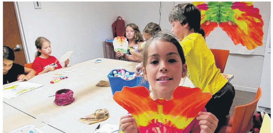
La relâche sera fort occupée au Moulin La Lorraine de Lac-Échemin.

Dans le Café du patrimoine, les intéressés pourront découvrir «Masques», exposition préparée par des élèves de 3e secondaire de l'école des Appalaches. Enfin, dans la Salle Pierre-Beaudoin, l'exposition-concours 10e anniversaire du Moulin, «Penser le temps», regroupera des œuvres d'une trentaine d'artistes. Cette dernière exposition est assortie d'un jeu d'observation à l'attention des jeunes. De plus, le public est encouragé à voter pour déterminer un prix «Coup de cœur» qui sera attribué au terme du concours.