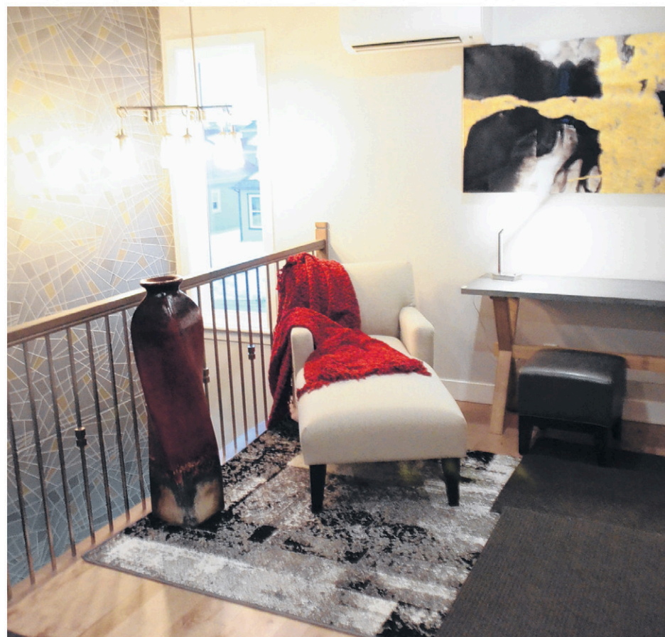
La mezzanine à l'étage peut servir comme espace de détente.