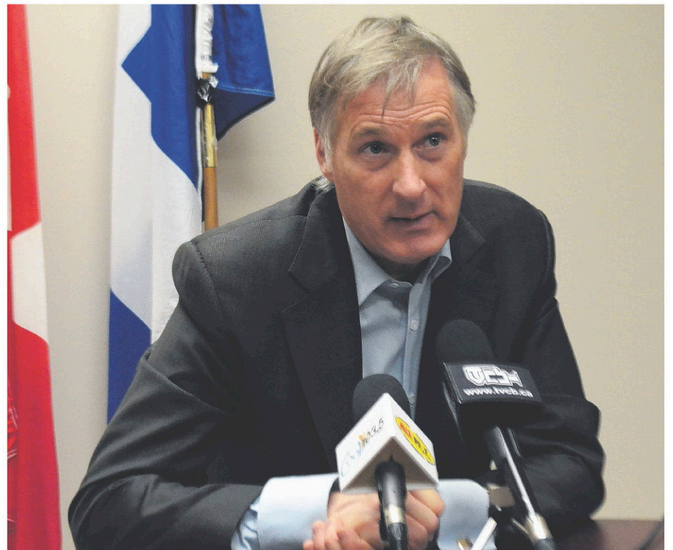
Maxime Bernier a présenté presque tous les éléments de sa plate-forme électorale.

Au Québec, les types d'immigration sont limités en raison d'une politique priorisant les nouveaux arrivants parlant le français. «C'est la seule province qui intervient dans la politique d'immigration à cause d'une loi spéciale. C'est