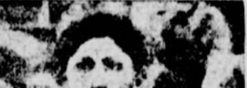
THOMAS LONGBOAT, INDIEN

Les élections du cercle article body text.