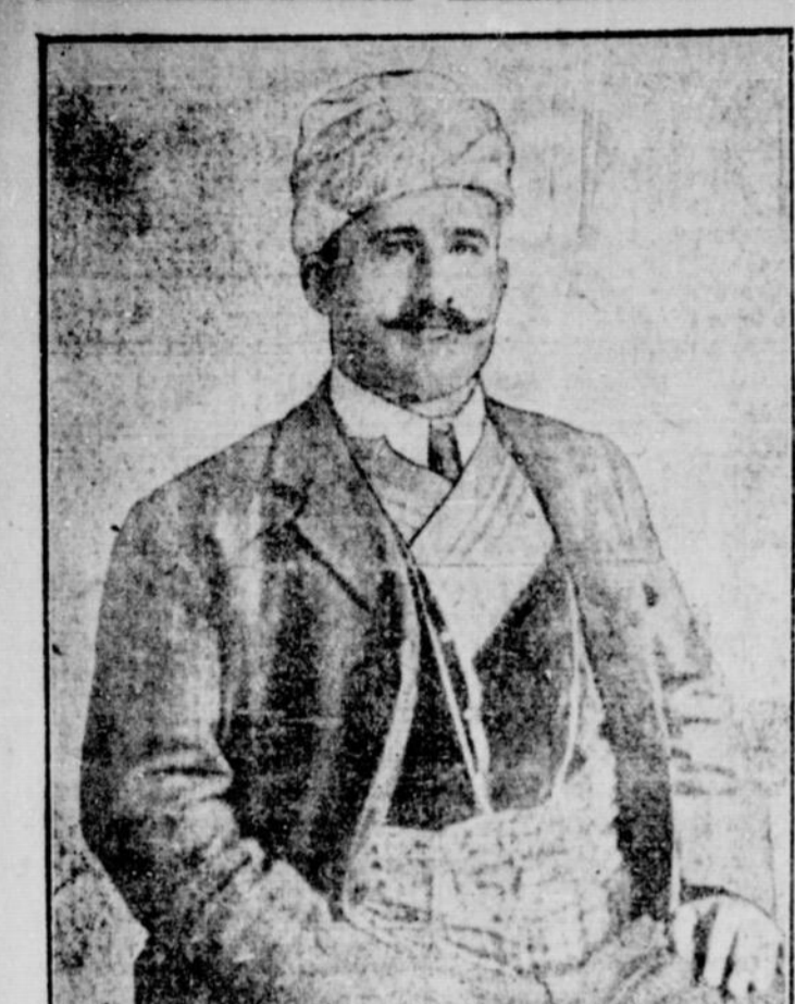
LE CELEBRE LUTTEUR TURC YUSSEF MAHMOUT.