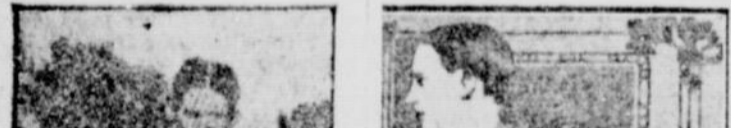
ALBERT COREY, FRANÇAIS

Les élections du cercle article body text.