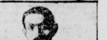
ALFRED SHRUB, ECOSAIS

Les élections du cercle article body text.