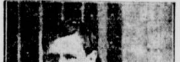
HENRI SIBET, FRANÇAIS

Les élections du cercle article body text.