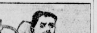
DORANDO PIETRI, ITALIEN

Les élections du cercle article body text.