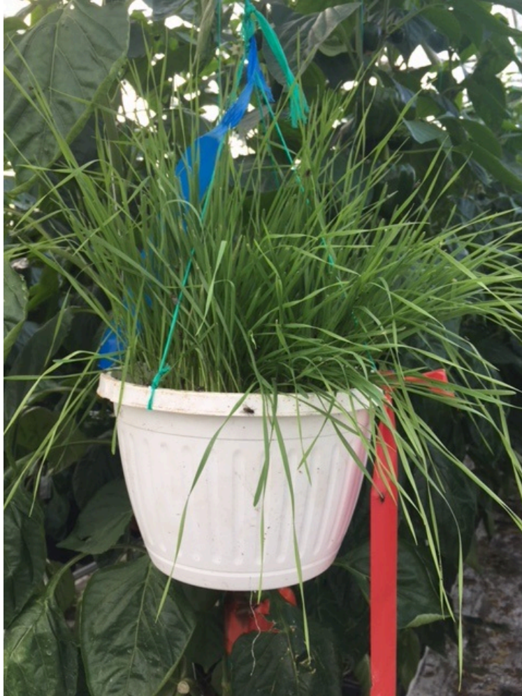
Plantes réservoirs de blé Collaborateur anonyme du RAP