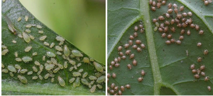
Puceron vert du pêcher ( Myzus persicae var. persicae ) – forme verte dominante Bon contrôle biologique avec Aphidius