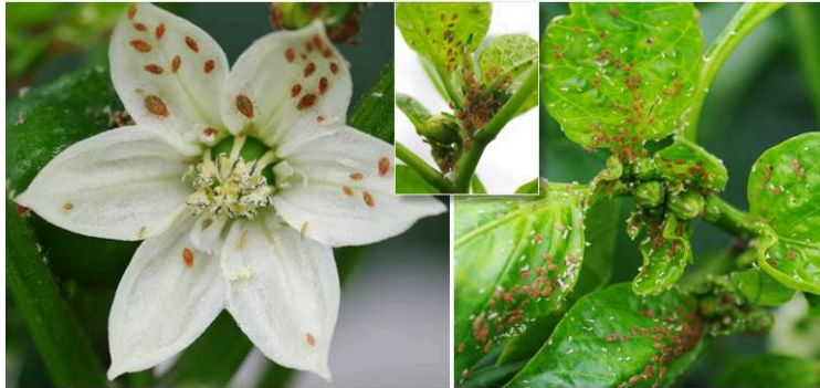
Puceron du tabac ( Myzus persicae var. nicotinae ) Forme rouge dominante avec une nette tendance à s'agglomérer à l'apex Contrôle biologique plus difficile