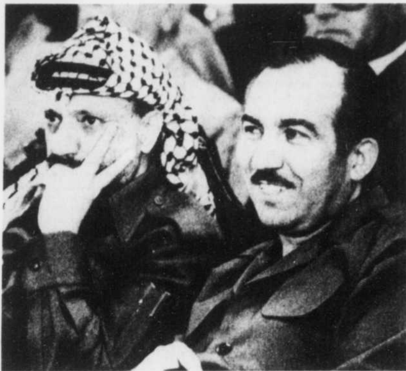
Le chef de l'Organisation de libération de la Palestine, Yasser Arafat, à gauche, en compagnie du numéro 2 de l'organisation, Abou Jihad, au cours d'une réunion en 1983.

"Je considère la liquidation d'Abou Jihad comme (...) un acte de justice. L'homme était depuis plusieurs années derrière de cruels actes de terrorisme contre l'Etat d'Israël", a dit le général.