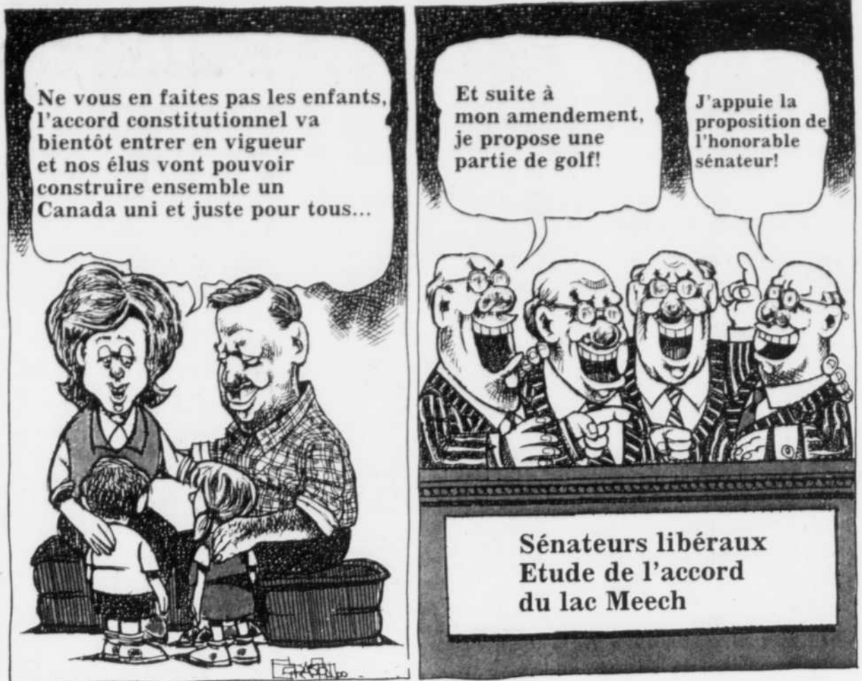
Sénateurs libéraux Étude de l'accord du lac Meech