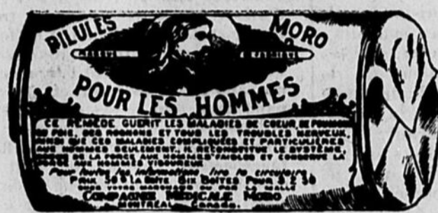
L'Étiquette est de papier blanc imprimé en bleu.

Fac-Simile exact d'une boîte de Pilules Moro.