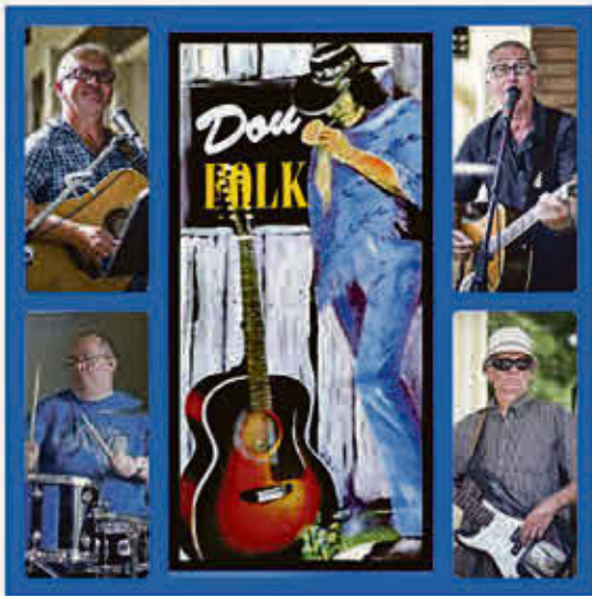
DouFolk 19 juillet