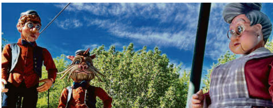
Le Théâtre de la Dame de Cœur présente, depuis le 1er juillet, sa nouvelle création éclatée Victor et le cadeau des songes .

Solange Laroche soutient que le TDC a une formule gagnante afin de connaître un grand succès d'été en été. « Pour notre nouvelle production, on a acquis récemment de nouveaux équipement scéniques et c'est vraiment très apprécié des spectateurs. De plus, le site est très accueillant et il y a plusieurs activités à faire durant la journée », conclut-elle. Les représentations ont lieu du mercredi au dimanche à 20 h 30 en juillet et à 20 h en août. Information : 450 549-5828 ou damedecoeur.com .