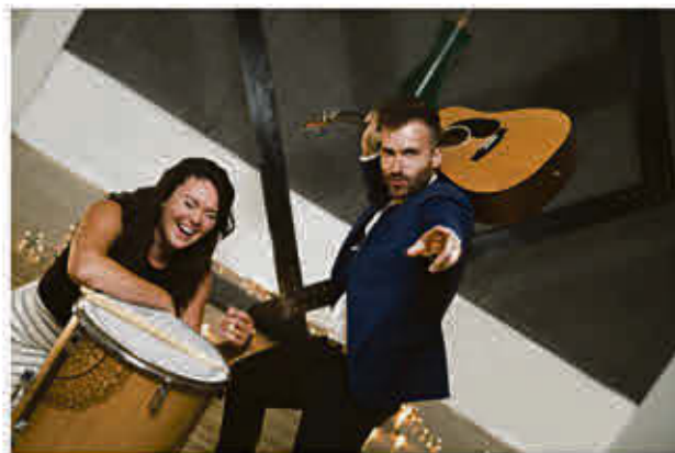
River and Blocks 1ère partie 2 août