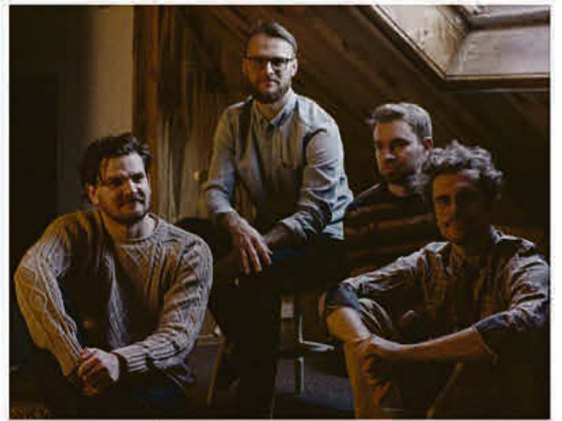
Bel Ours 26 juillet