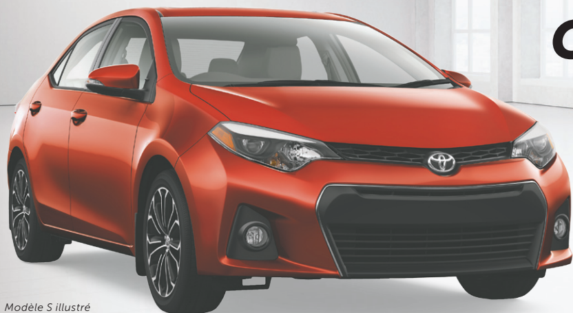
Modèle S illustré

AUCUN PAIEMENT PENDANT 90 JOURS AVEC LE FINANCEMENT À L'ACHAT†