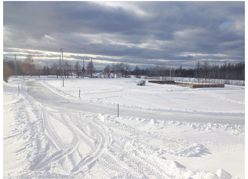
L'offre d'activités hivernales du parc Louisbourg a été améliorée cette année.

« Nous voulons commencer une petite tradition, pour promouvoir le sport hivernal, nos infrastructures, et la visibilité de nos équipes de hockey mineur », conclut M. Poirier.