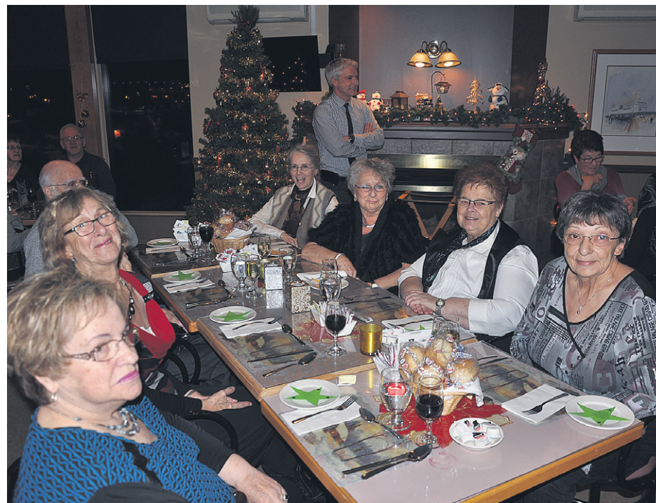
Plus de 60 personnes seules de la ville de Carleton-sur-Mer ont été invitées à cette belle soirée.

Ce dernier ajoute que tout le monde est bénévole à ce souper : « les musiciens sont bénévoles, les serveuses sont bénévoles, il