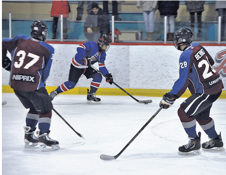
L'action n'a pas manqué ce weekend au Tournoi interrégional midget de New Richmond.

grande finale par la marque de 4 à 2 contre Transport Renard de Rivière-au-Renard. Du côté atome, les Aigles pêcheurs de New Richmond ont vaincu G.D. Constructions de Rivière-au-Renard 4-3 pour s'envoler avec le titre de champions.