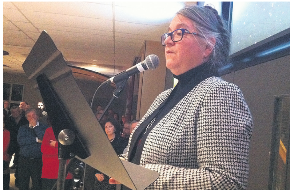
La ministre libérale de la Gaspésie-les-Îles, Diane Lebouthillier.