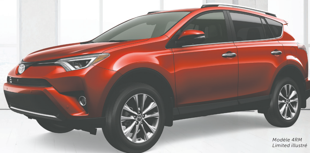
Modèle 4RM Limited illustré