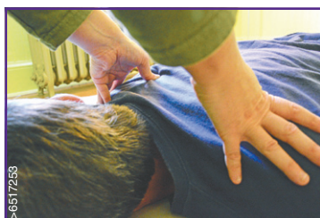
Centre de santé du Vieux Presbytère

Le yoga et le vélo : deux traits caractéristiques du mode de voyage de la Marianne d'origine.