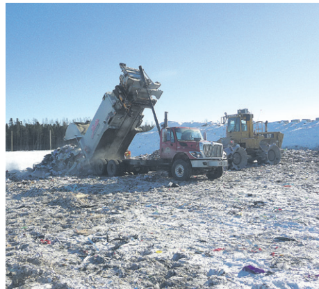
Le LET de Saint-Alphonse dessert toute la Baie-des-Chaleurs.

« L'échantillonnage a été réalisé à la période de l'année où la présence de matières en suspension, de matière organique et d'éléments nutritifs dans l'effluent est la plus forte, soit juste avant la fermeture hivernale de la station de traitement du LET. Le fait que les concentrations mesurées soient supérieures à la normale pour certains paramètres était donc prévisible. C'est pourquoi il est important