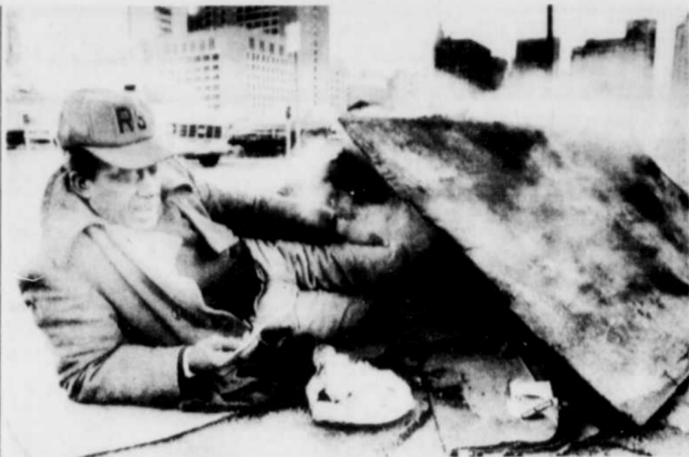
Au-dessus d'une bouche de chaleur, dans une rue de Philadelphie, cet homme lit une carte de Noël, abrité sous un abri de planches et de cartons. Il est chômeur; il n'a pas de maison et c'est tout ce qu'il a trouvé pour se protéger du froid intense qui balaie les Etats-Unis. Triste Noël...

Pendant ce temps, à l'autre extrémité du pays, à Vancouver, où le mercure ne descend jamais de façon marquée, il est passé sous les -5 C, un réel problème pour les nombreuses prostituées arpentant les trottoirs