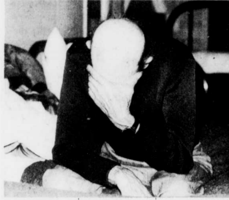
Dans plusieurs villes du Canada, des hommes sans foyer, des femmes, des enfants, fuyant le froid intense de ce dur hiver, sont obligés de se réfugier dans des foyers et des abris d'urgence, comme ici à Toronto.