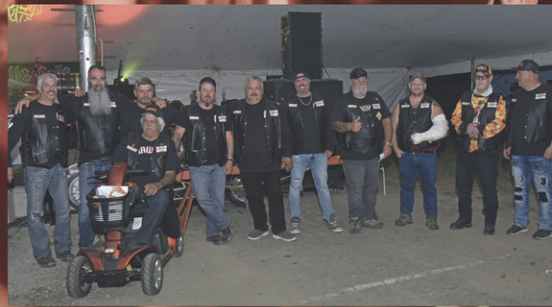
Membres du club de Moto les Hawks de Maniwaki