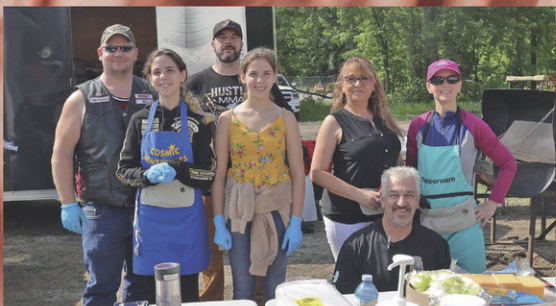
Kiosque du Casse-croûte des Hawks

Organisé par le club de Moto les Hawks de Maniwaki, au profit de Suicide Détour