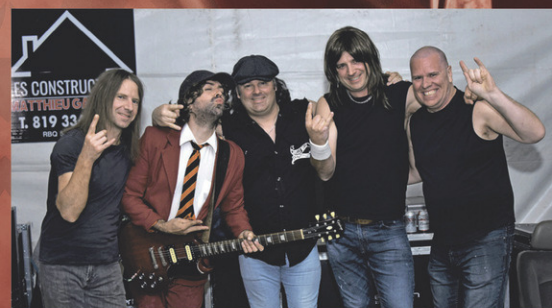
Groupe HELLS BELLS Hommage à AC/DC