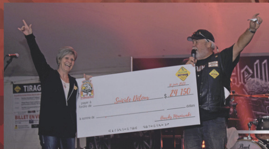
Remise du chèque 24 750.00 $