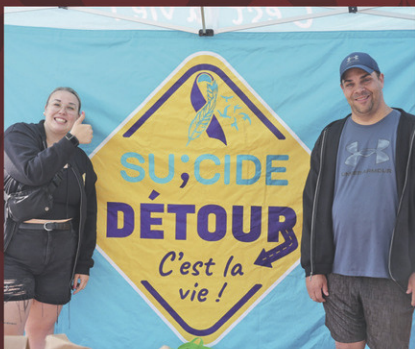
Kiosque de Suicide Détour