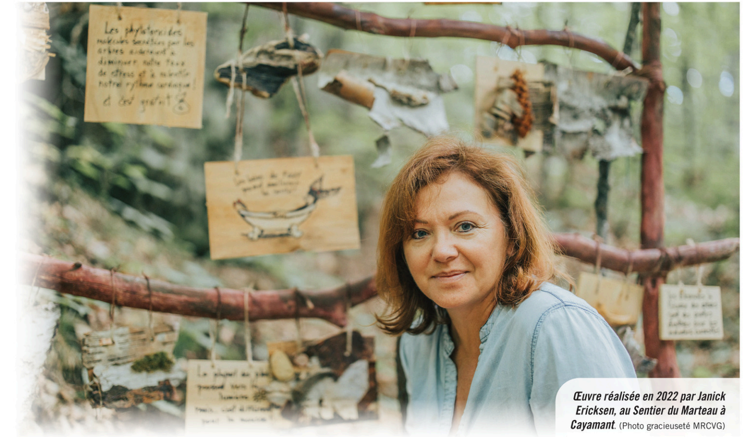
Œuvre réalisée en 2022 par Janick Ericksen, au Sentier du Marteau à Cayamant.

L'idée derrière ce projet vise à développer et diversifier les connaissances culturelles dans la Vallée-de-la-Gatineau. La Veine d'Art s'inspire du « Land Art » qui est un style d'art contemporain qui est de plus en plus connu dans la région grâce à ce projet qui s'est installé dans la MRCVG pour une troisième année. Le « Land Art » provient d'artistes qui désiraient sortir l'art des galeries et des musées. C'est un concept créatif en harmonie avec la nature. L'artiste utilise des matériaux entièrement naturels (branches, roches, feuillages, foin, etc.). Ce qui permet à l'œuvre d'évoluer jusqu'à ce