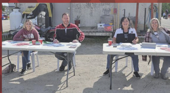
Croupiers / Croupières