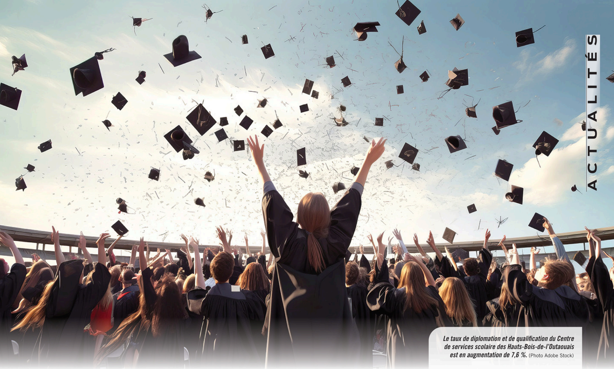
Le taux de diplomation et de qualification du Centre de services scolaire des Hauts-Bois-de-l'Outaouais est en augmentation de 7,6 %.