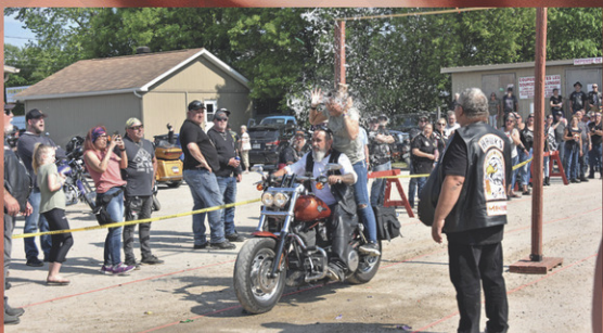
Splash - jeu ballon