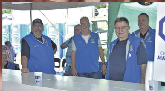
Kiosque du Bar des Optimistes