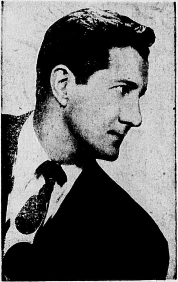
Eddie Schaffer, un des plus brillants comédiens américains. L'heure que la direction du cabaret El Morocco présentera une vedette de son prochain spectacle à compter de lundi soir prochain.