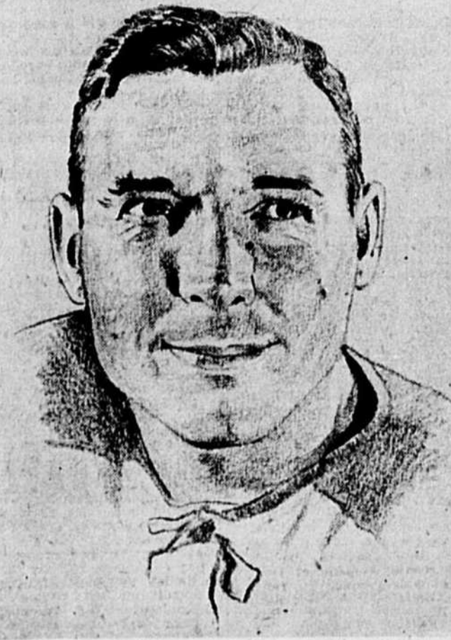
Buddy O'Connor doit sûrement faire regretter à Dick Irvin de l'avoir échangé aux Rangers. En effet, au Forum, hier soir, O'Connor a encore une fois contribué à la défaite des Habitants en obtenant trois assistances, alors que les Rangers ont eu raison des Habitants par 4 à 2. En obtenant trois assistances, O'Connor est monté en deuxième position chez les compteurs, sur un pied d'égalité avec Elmer Lach et Maurice Richard.