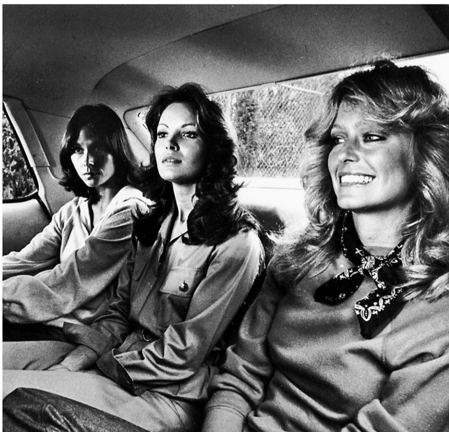
Kate Jackson, Jaclyn Smith et Farrah Fawcett