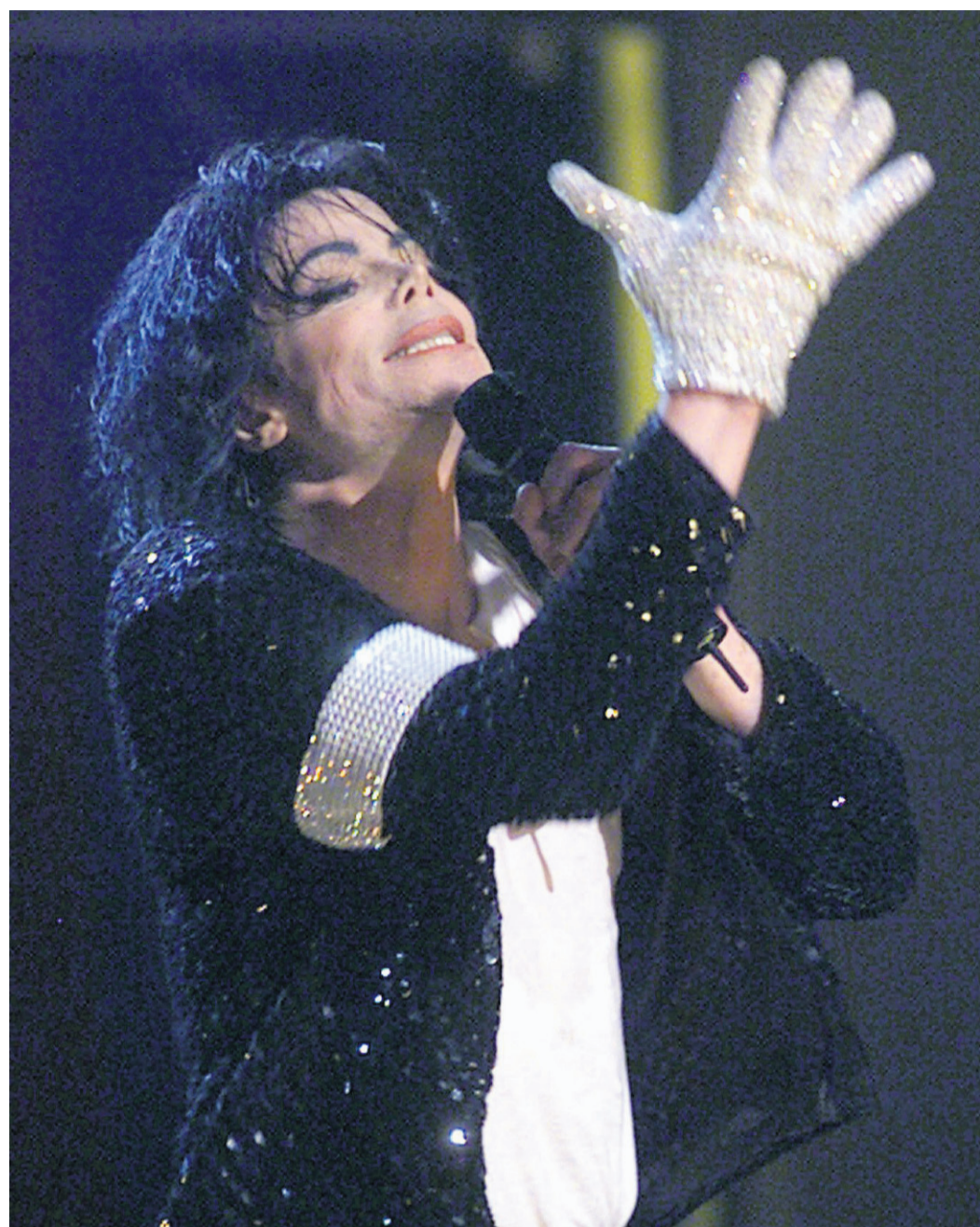
Michael Jackson photographé en 1974 durant un spectacle des Jackson Five. On le voit 27 ans plus tard lors d'un concert à New York, en septembre 2001.