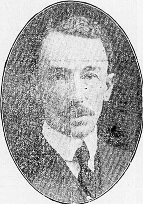
L'hon. M. L.-A. TASCHEREAU, dont le gouvernement a été maintenu au pouvoir

Durant une heure environ, alors que les rapports nous étaient donnés par la Radio, on crut que le gouvernement serait défait; mais les derniers rapports changèrent le courant et assurèrent au premier ministre L.-A. Taschereau, son maintien au poste qu'il occupe depuis 1920.