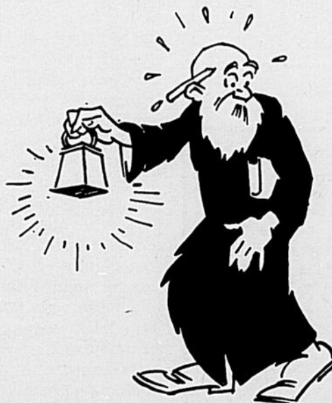
Diogène a trouvé son homme; il cherche une maison pour le loger...

10 minutes de culture spirituelle par jour