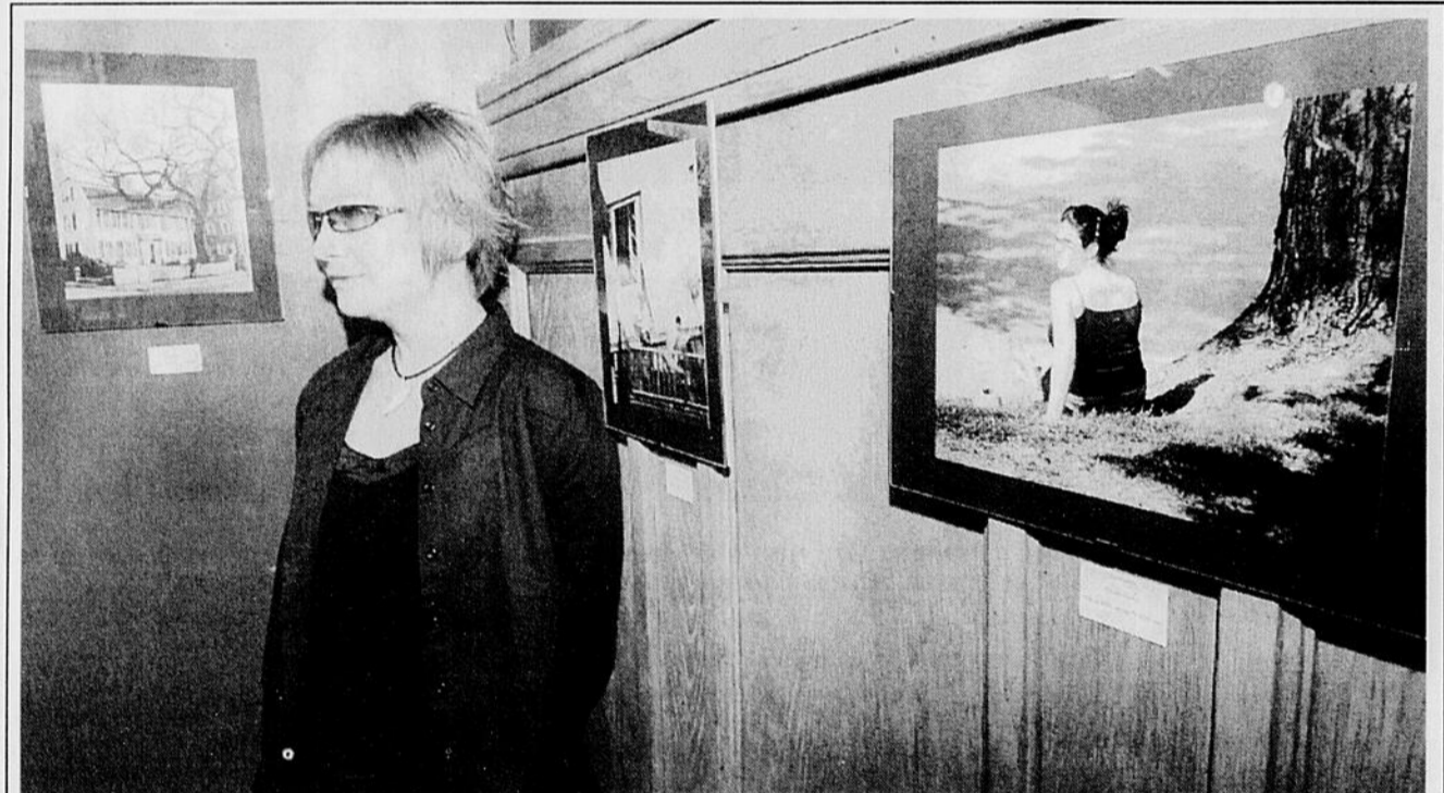
Imacom, Maxime Picard

6790, route Louis-S.-St-Laurent, Compton • Visitez le magasin général paternel et la maison natale de Louis S.-St-Laurent. Le 1er juillet, visitez le site gratuitement. Ouvert tous les jours, 10 h à 17 h.