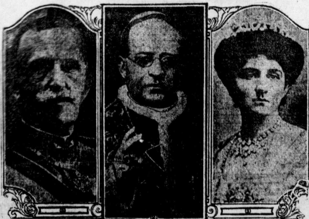
La visite officielle des souverains d'Italie au Vatican, a eu lieu le 5 décembre. 1) Le roi d'Italie, Victor Emmanuel; 2) Le pape Pie XI; 3) La reine Helène.