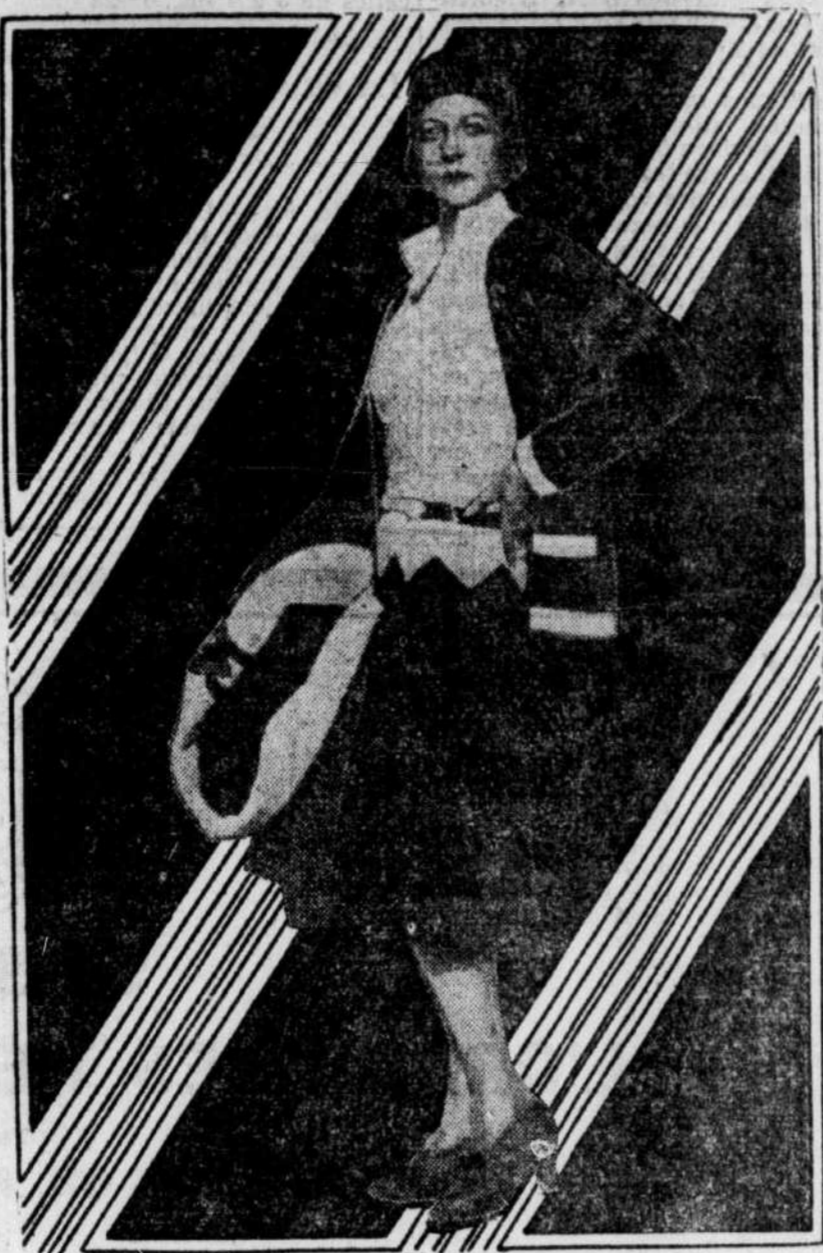
Une charmante robe-ensemble pour le sport. Elle comprend une blouse de laine blanche, une jupe et un veston noirs; celui-ci est garni de blanc et la jupe est plissée dans le bas.