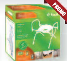
Chaise d'aisance pliante Facili-TMC