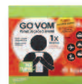
Sacs vomitoires super-absorbants