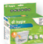
Kit vomitoire super-absorbant