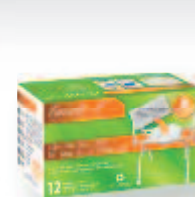
Enveloppes hygiéniques® super-absorbantes