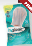
Gants nettoyants humides