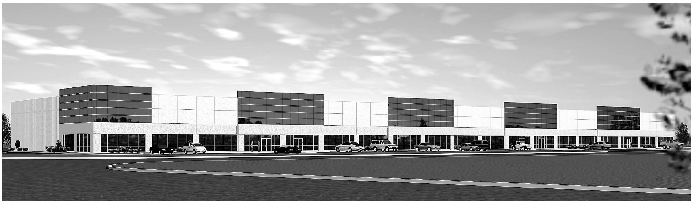
Le nouveau complexe industriel, construit au coût de 70 millions de dollars, accueillera des bureaux et des entrepôts, à Laval.

CAHIER F | LA PRESSE | MONTRÉAL | SAMEDI 14 JUIN 2003