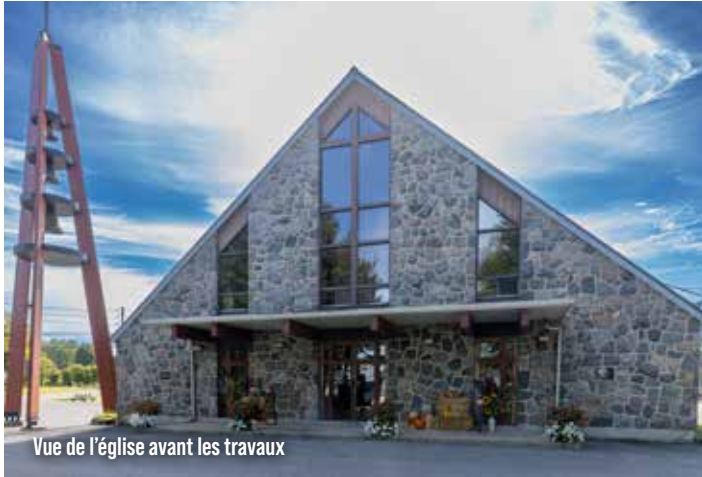
Vue de l'église avant les travaux