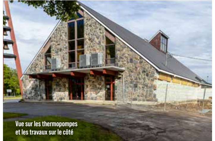
Vue sur les thermopompes et les travaux sur le côté