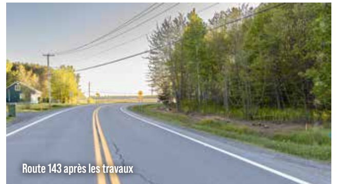
Route 143 après les travaux