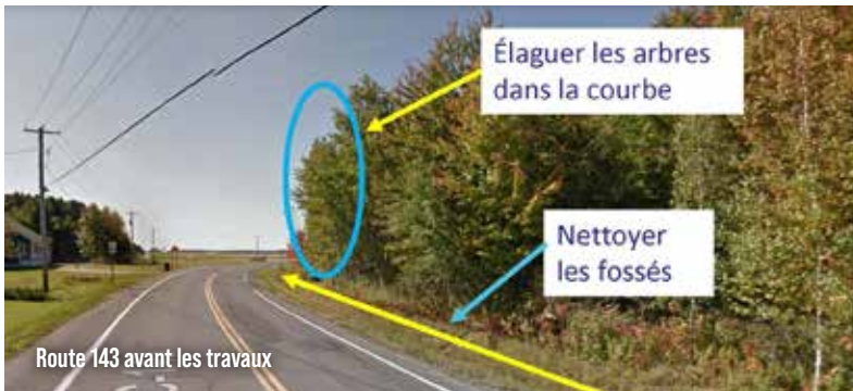
Route 143 avant les travaux

Comme plusieurs d'entre vous ont pu le constater, le ministère des Transports du Québec a procédé à l'élagage et à la coupe d'arbres dans les deux courbes de la route 143 à la hauteur du 6 e Rang. Espérons que ce dégagement améliorera la sécurité à cet endroit. S'ajouteront bientôt les délinéateurs et de nouveaux panneaux de signalisation de vitesse réduite.