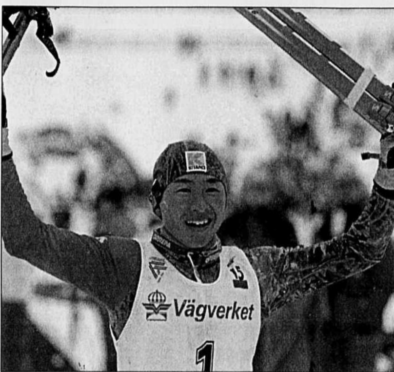
L e Japonais Kenji Ogiwara, numéro un mondial du combiné nordique.

La Russe Lioubov Egorova, championne olympique sur la distance l'an passé, a dû se contenter d'une décevante 15e place à 3 min 8 sec de sa compatriote.