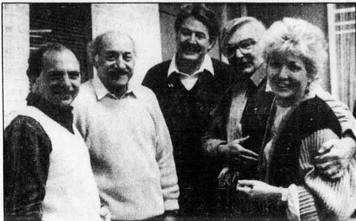
Le sourire de la station N° 1, CKAC: Claude Charron, Roger Joubert, Pierre Pascau, Jacques Proulx et Suzanne Lévesque.

ment du déménagement de leur antenne sur le Mont-Royal, ce qui leur permet de rejoindre plus de monde qu'avant.