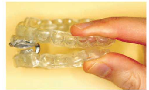
Orthèse d'avancement mandibulaire

broyants ne bénéficient pas d'un sommeil réparateur puisqu'ils n'atteignent pas le sommeil profond. Sans compter qu'ils nuisent aussi au sommeil de leur conjoint. « L'orthèse est moulée sur les dents et une fois mise en bouche ne se voit pas du tout. Généralement, les patients s'y adaptent facilement et sont ravis des résultats » d'ajouter le Dr Masse.