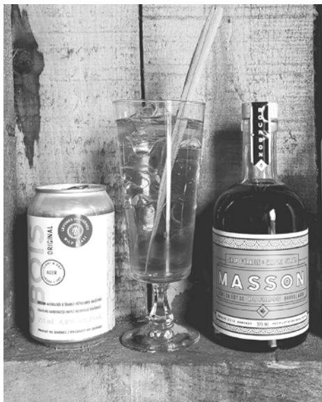
La nouvelle boisson Millebois Original Levures Indigènes et le sirop Masson vieilli en fût de bourbon.

Ce printemps, Millebois entame sa troisième année d'existence. En 2018, les boissons comptonaises ont gagné en popularité, notamment grâce à leur présence au Marché de Soir de Compton et, depuis, elles rayonnent de plus en plus partout au Québec. De nouveaux produits, le Mousseux et l'Ambré, entre autres, ont agrandi la famille des boissons de l'Érable à boire. Et d'autres encore viennent s'ajouter à leur offre déjà fort intéressante.