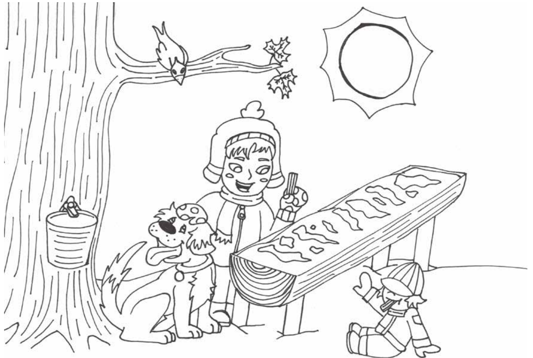
ILLUSTRATION : JORDANE MASSON