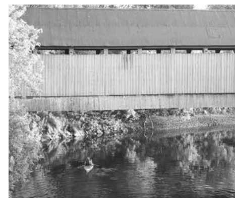
Le pont Drouin qui surplombe la rivière Coaticook

« La Municipalité doit gérer de plus en plus les conséquences d'inondations importantes, d'embâcles et de pluies torrentielles, expliquait Bernard Vanasse, maire de Compton, lors de cette conférence. Et pour assurer la sécurité de nos citoyens, il est incontournable de se doter de solutions. Nous espérons donc que ce projet nous apportera des réponses concrètes du point de vue financier pour la mise en place de mesures d'adaptations aux inondations à Compton. »