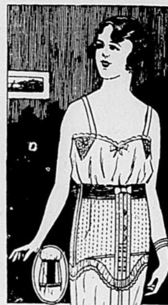
127 PERFECTION CORSETS

Pour dames, faits de soie, doublés de laine, jambe façonnée, teinte de gris, brun, drab, noir, 8 1/2 à 10. Valeur de .69 3 paires pour $1.00.