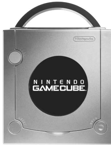
MC et © sont des marques de commerce de Nintendo. Nintendo of Canada Ltd., usager autorisé. © 2002 Nintendo.