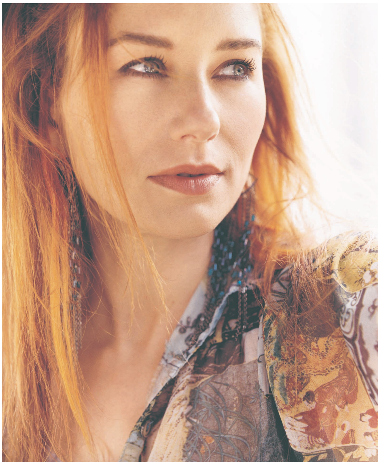
Sur son dernier disque, Scarlet's Walk , Tori Amos propose un voyage dans les profondeurs des États-Unis.

Sur son septième album, Tori Amos s'est engagée dans une quête spirituelle, où son alter ego, Scarlet, sillonne les routes de l'Amérique. Pour mieux se comprendre, bien sûr, mais aussi pour « toucher à l'essence de son pays ». Au fil des 18 « nouvelles musicales », pour reprendre la formule lancée par la chanteuse, de la Virginie à Las Vegas, en passant par New York, la Californie et le Nouveau-Mexique,