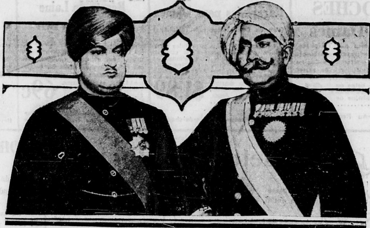
Les maharajahs du Kashmir (à gauche) et de Sikaner, Inde, deux des 90 Hindous qui représentent leur pays à la conférence de la table ronde de Londres.