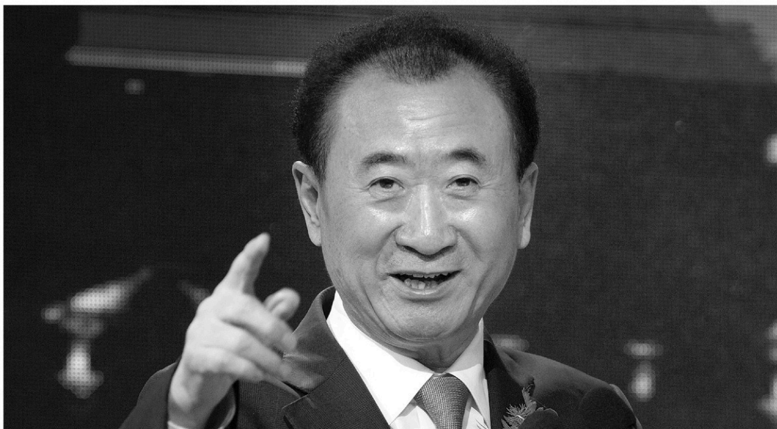
Wang Jianlin, l'homme le plus riche de Chine a instamment demandé à M. Trump de ne pas ruiner l'industrie des loisirs par une guerre commerciale.