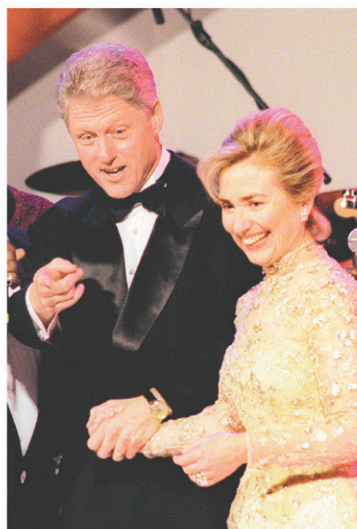
Les Clinton ont visité 14 bals en janvier 1997.

Là où Donald Trump se démarque de ses prédécesseurs, c'est lorsqu'il annonce la fin d'une certaine mondialisation naïve