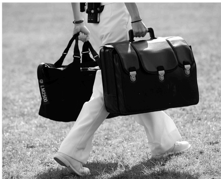
Un aide de camp de l'armée américaine porte en permanence la mallette contenant les codes nucléaires.

Juste avant la cérémonie, Donald Trump va avoir un premier