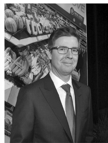
Galen G. Weston