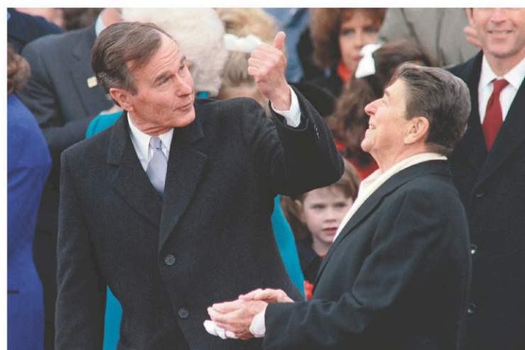
Le président George Bush père discutant avec son prédécesseur Ronald Reagan lors de sa cérémonie d'intronisation en 1989

Le 30 avril 1789, pour le premier couronnement républicain, les cloches des églises sonnent et l'artillerie