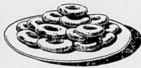
La Farine Regal se vend en sacs de 98, 49 et 24 livres et en sac pratique de 7 livres avec poignée