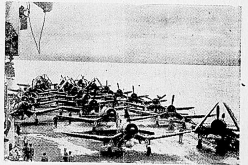
Photo prise à bord d'un porte-avions britannique pendant le raid accompli contre le centre ferroviaire japonais de Sigli. La photo permet de voir vingt-six avions prêts à décollage, et un réservoir d'essence.