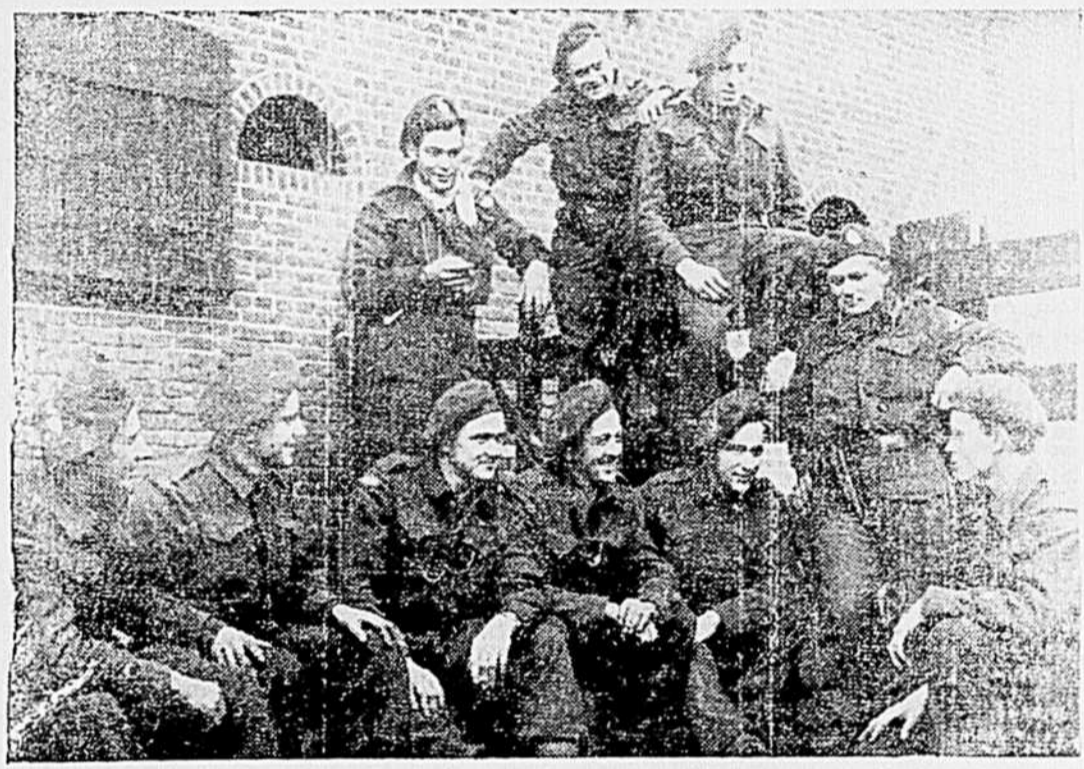
Voici un groupe d'éclaireurs d'un fameux régiment canadien-français prenant quelques moments de détente quelque part outre-mer et devisant de leurs projets.

FARINE REGAL MOULUE PAR LA ST. LAWRENCE FLOUR MILLS COMPANY, LIMITED, MONTREAL