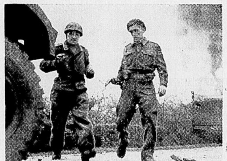
Cette photo montre un soldat britannique accompagné un Allemand qui vient de sortir d'une maison en flammes. Un certain nombre de prisonniers ont été ainsi capturés, malgré la vive résistance de l'ennemi.

Cette maman canadienne répondra à son fils de ne pas s'inquiéter car ici, au Canada, les prix sont contrôlés. N'oublions pas cependant, que c'est sur chacun de nous que retombe la tâche de conserver cette situation. Et nous pouvons le faire en ne payant pas plus cher que les prix plafond... et respectant les lois du rationnement et en pratiquant la conservation. Mères canadiennes, sachez utiliser et faire durer vos vêtements.