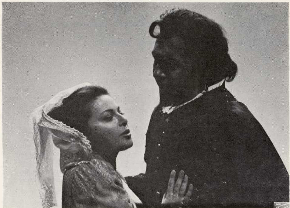
Zerlina ( Grazielli Sciutti ), Don Giovanni ( Cesare Siepi )