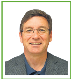
YVES LÉVESQUE DIRECTEUR RÉGIONAL MINISTÈRE DE L'AGRICULTURE, DES PÊCHERIES ET DE L'ALIMENTATION