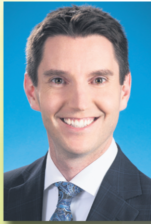
André Fortin Député de Pontiac Adjoint parlementaire du ministre des Finances.