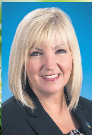
Maryse Gaudreault Députée de Hull Vice-présidente de l'Assemblée nationale.