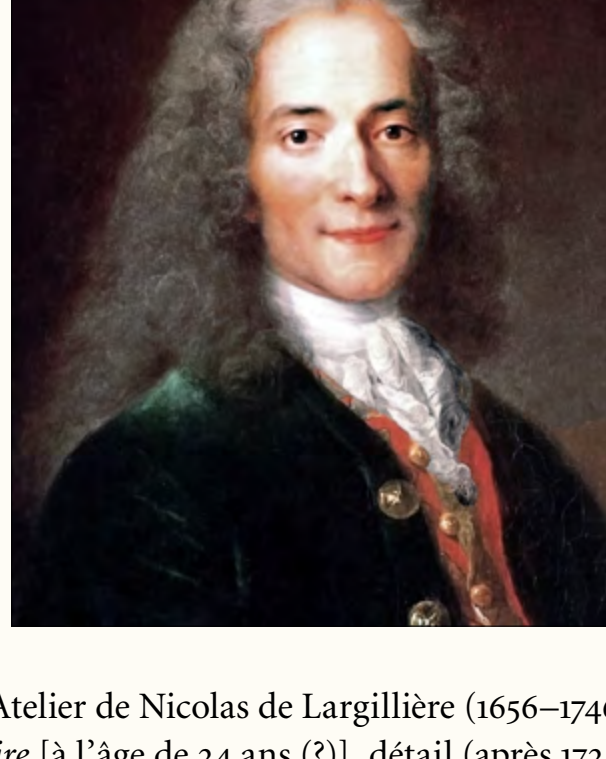
Atelier de Nicolas de Largillière (1656–1746), Voltaire [à l'âge de 24 ans (?)], détail (après 1724-1725), collection du musée Carnavalet, Paris, France.

Odilon Redon, né Bertrand Jean Redon (1840-1916), « O ».